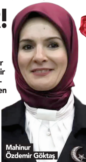
Mahinur Özdemir Göktaş

Belediyesi, kentin tarihi ve kültürel mirasının önemli yapılarından biri olan Tarihi Köle Hanı'nı yeniden şehre kazandırıyor. Restorasyon çalışmaları tamamlanan Tarihi Köle Hanı'nın açılışı, bugün Aile ve Sosyal Hizmetler Bakanı Mahinur Özdemir Göktaş'ın katılımıyla gerçekleştirilecek.