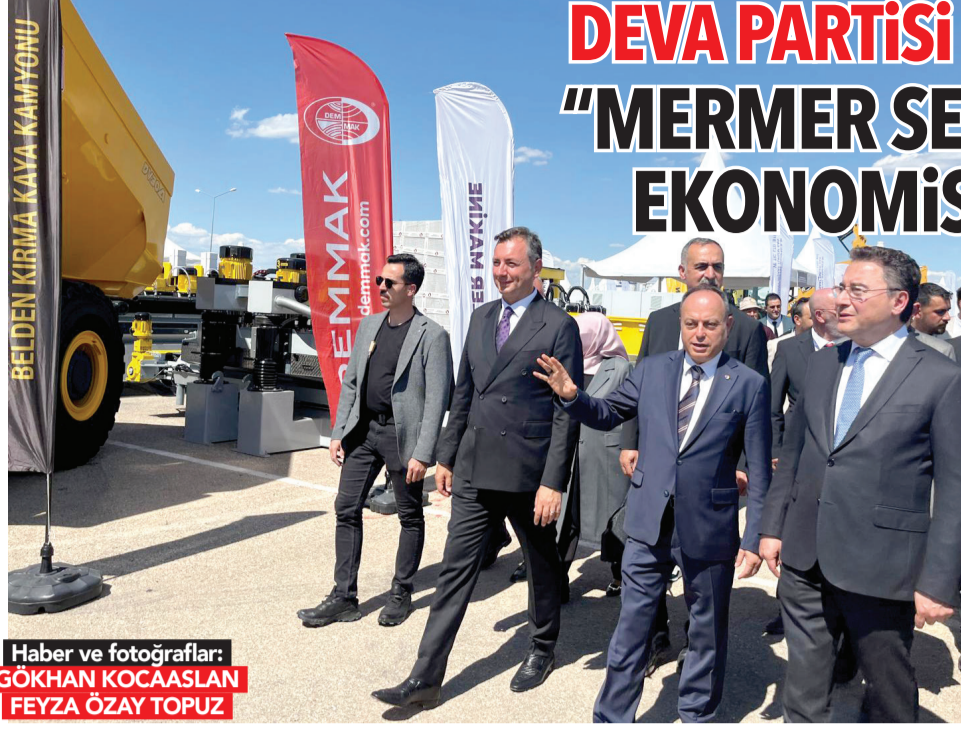
Haber ve fotoğrafçılar: GÖKHAN KOCAASLAN FEYZA ÖZAY TOPUZ

Afyonkarahisar'da kalıcı ve modern bir fuar alanı oluşturulması için çalışmaların sürdürüldüğünü belirten Yurdunuseven, bu hedefin hem yerel yönetimler hem de merkezi idare tarafından desteklendiğini söyledi. Şehrin fuarcılık alanında daha güçlü bir konuma gelmesi gerektiğini vurguladı. Konuşmasında fuarın düzenlenmesinde emeği geçen tüm kurum ve kuruluşlara teşekkür eden Yurdunuseven, özellikle bakanlıklar, milletvekilleri, valilik, belediye ve oda başkanlıklarının katkılarını vurguladı.