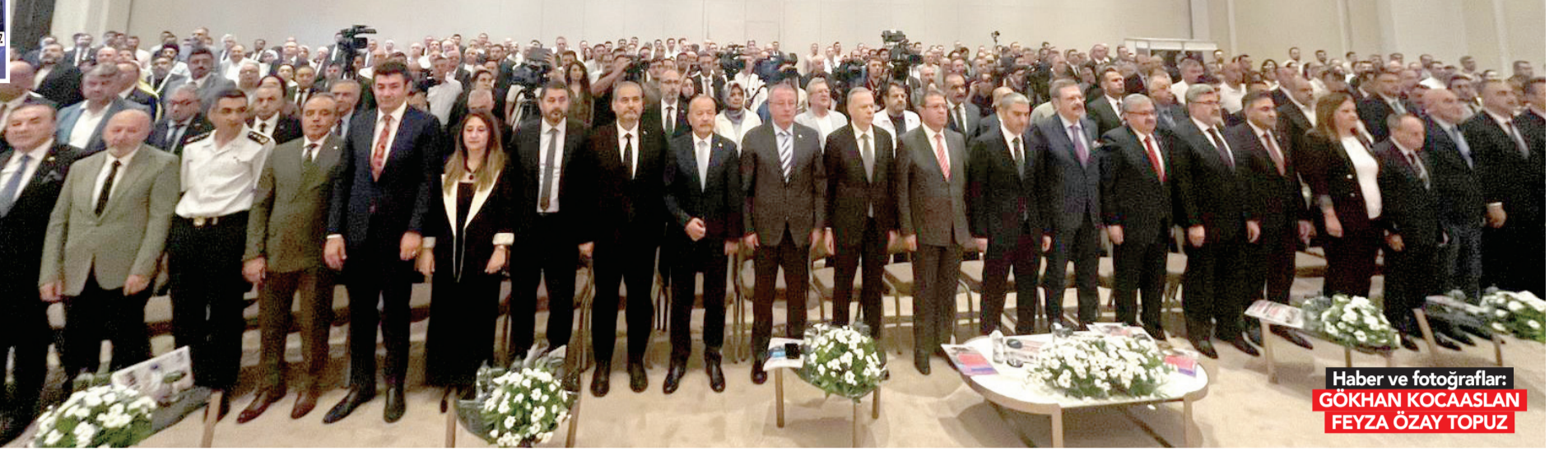
Haber ve fotoğraflar: GÖKHAN KOCAASLAN FEYZA ÖZAY TOPUZ