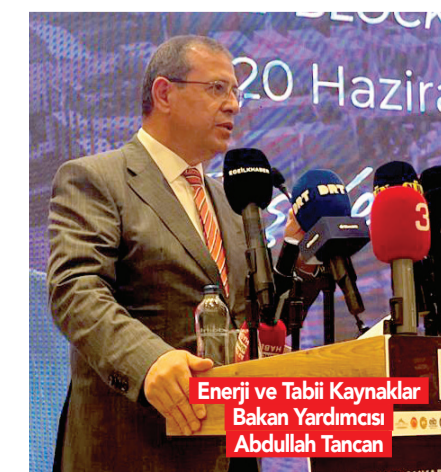
Enerji ve Tabii Kaynaklar Bakan Yardımcısı Abdullah Tancan

Tancan, fuarın yalnızca bir ticari organizasyon olmadığını, aynı zamanda sektörün geleceğine yön verecek yeni iş birliklerine, yatırımlara ve ihracat fırsatlarına kapı araladığını söyledi. Tancan, Bu tür organizasyonların sektörün gelişimi açısından büyük önem taşıdığını vurguladı. Türkiye'nin Alp-Himalaya kuşağında yer alması nedeniyle dünyanın en zengin mermer yataklarına