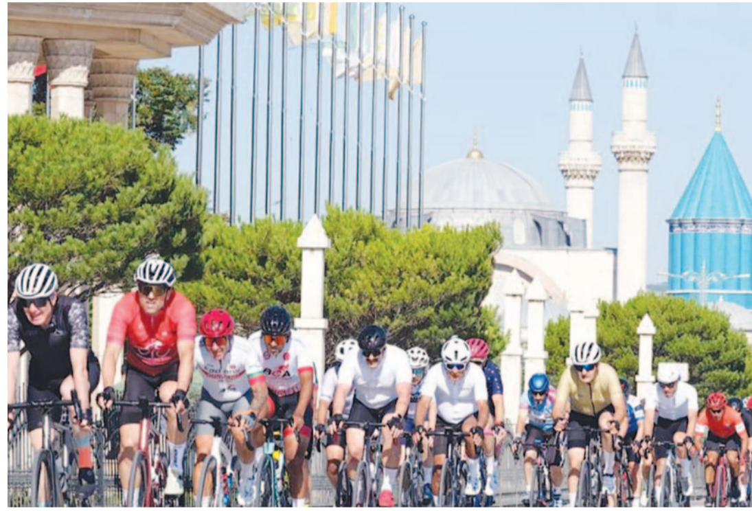
Meram Bağları'ndan verilen startla başlayan yarışta sporcular, şehir merkezinde belirlenen kısa ve uzun parkurlarda kıyasıya mücadele etti.

2026 Avrupa Bisiklet Başkenti ilan edilen Konya, uluslararası bisiklet organizasyonlarına ev sahipliği yapmayı sürdürürken ilk kez düzenlenen Granfondo Bisiklet Yol Yarışı ile farklı ülkelerden sporcuları aynı parkurda buluşturdu