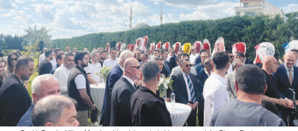
DoubleTree by Hilton Afyonkarahisar bünyesinde hizmet verecek Le Piraye Restaurant, il protokolü, iş dünyası temsilcileri ve çok sayıda davetlinin katılımıyla düzenlenen törenle açıldı.