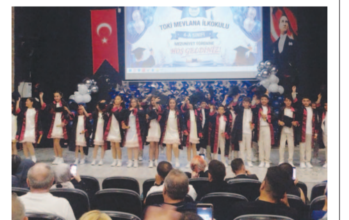
TOKİ Mevlana İlkokulu 4-A sınıfı öğrencileri, unutamayacakları bir mezuniyet gecesiyle ilkökula veda ederken, geleceğe umut ve heyecanla ilk adımlarını attı.