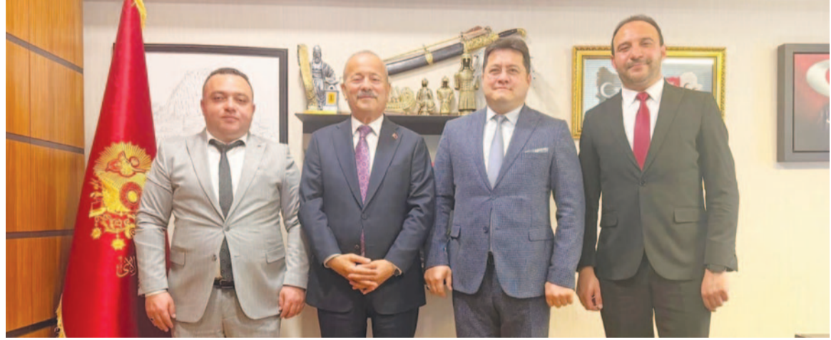
Ankara'daki temasların, Bolvadin'in kalkınma hedefleri doğrultusunda yürütülen çalışmaların güçlendirilmesi ve ilçenin ihtiyaçlarının ilgili kurumlara aktarılması açısından önemli bir adım olduğu belirtildi.

Bolvadin Belediyesi heyeti, ilçenin geleceğine yönelik önemli proje ve yatırımları değerlendirmek amacıyla Ankara'da bir dizi temas gerçekleştirdi