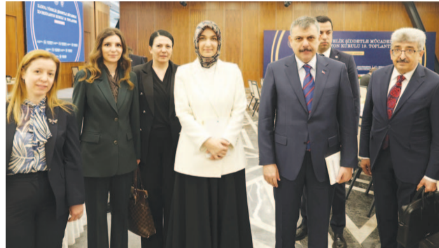
mekanizmalarının ortak sorumluluğu olduğu vurgulandı. Teknolojik altyapıdan adli süreçlere, sosyal hizmetlerden dini rehberliğe kadar geniş bir yelpazede yürütülen çalışmaların entegre şekilde güçlendirileceği belirtildi. Katılımcılar, "sıfır tolerans" ilkesinin tavizsiz uygulanacağını ve her bir vakanın önlenmesinin temel hedef olduğunu ifade etti.