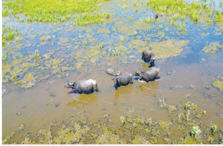
Sazlıklar arasında beslenen ve suyun içinde serinleyen mandaların oluşturduğu doğal görüntüler, bölgenin zengin biyoçeşitliliğini bir kez daha gözler önüne serdi.