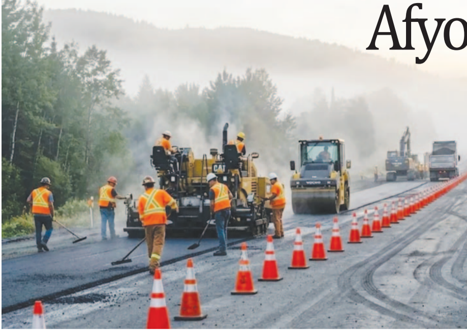
Afyonkarahisar Belediyesi ekiplerinin bölgedeki altyapı çalışmalarını planlanan süre içerisinde tamamlayarak yeni hobi bahçesi projesini vatandaşların hizmetine sunmayı hedeflediği belirtildi.