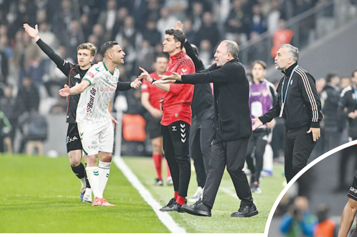
Siyah-Beyazlı ekip, geçtiğimiz sezonda olduğu gibi yine kendi sahasında kupaya veda ederken, Konyaspor ise kritik bir galibiyetle finale yükselmenin sevincini yaşadı.