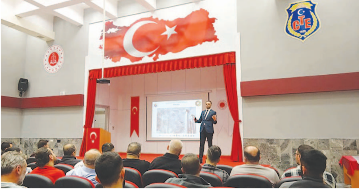
Etkinliğin, bireylerin ekonomik hayata kazandırılması ve istihdam bilincinin artırılması açısından önemli bir katkı sunduğu belirtildi.