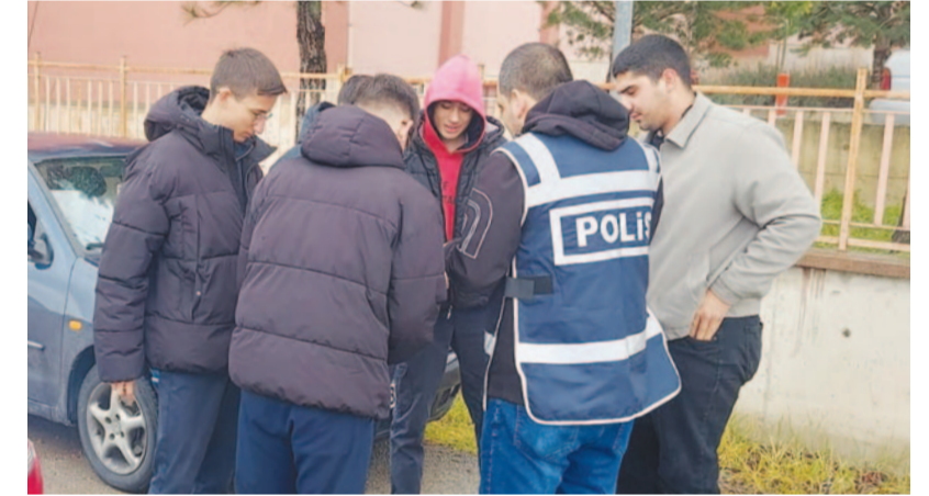
Afyonkarahisar İl Emniyet Müdürlüğü'nden yapılan açıklamada, çocukların suça sürüklenmesini ve suç mağduru olmalarını engellemenin öncelikli hedef olduğu vurgulandı.