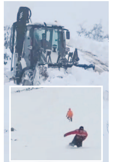
Afyonkarahisar'da bahar aylarının ortasında etkili olan yoğun kar yağışı, özellikle yüksek kesimlerde hayatı olumsuz etkiledi.