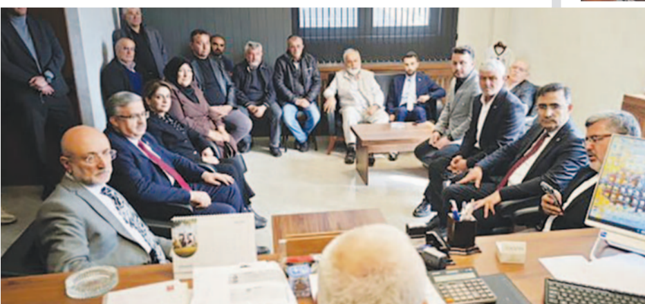
AK Parti Afyonkarahisar teşkilatı, Evciler ilçesinde bir dizi ziyaret ve temaslarda bulundu.