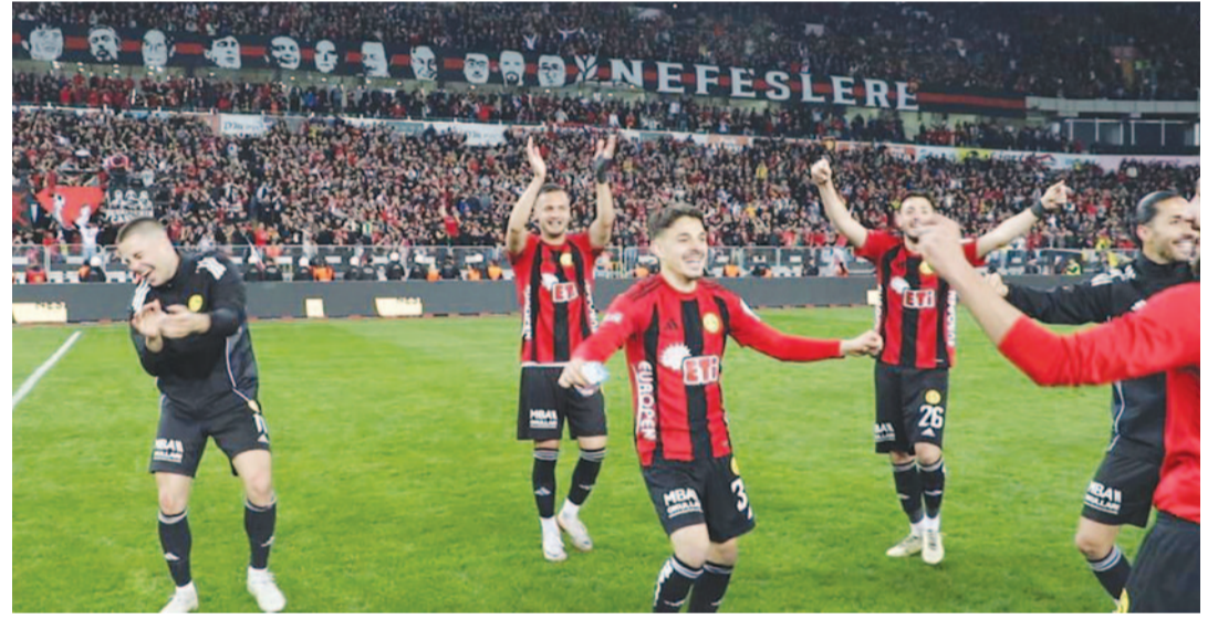
Hakemin son düdüğüyle birlikte statta adeta bayram havası yaşandı. Tribünlerde büyük coşku yaşanırken, saha içinde futbolcuların kutlamaları renkli anlara sahne oldu.