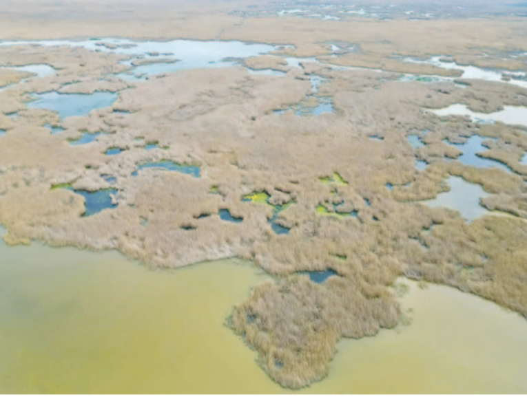
'gölün kurduğu ve göldeki yaşamın sona erdiği' iddialarının gerçek dışı olduğunu ortaya koydu.

Geçtiğimiz yıllarda kuraklık tehlikesinin baş gösterdiği ve suların çekilmesinden dolayı karaya oturan kayıkların adeta bir kayık mezarlığına dönüştüğü gölde son aylarda artan yağışlar ile sevindirici gelişmeler yaşanmaya başladı. Göldeki su seviyesinin gözle görülür şekilde arttığını gözlenirken, eskiden sular çekildiği için karaya oturan kayıklar sular altında kalırken, birçok adacığın da yine artan su seviyesinden dolayı artık görülmediği gözlemlendi. Dron ile çekilen görüntüler, Eber Gölü Yaşasın Hareketi Başkanı Ekrem Önder Çiftçi'nin, geçtiğimiz günlerde bazı siyasi parti ile başkanları ile yaptığı basın açıklamasındaki