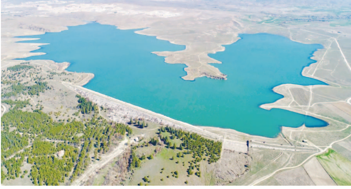
Balta, kent genelinde tamamlanan 589 su yapısının vatandaşların hizmetine sunulduğunu açıkladı.