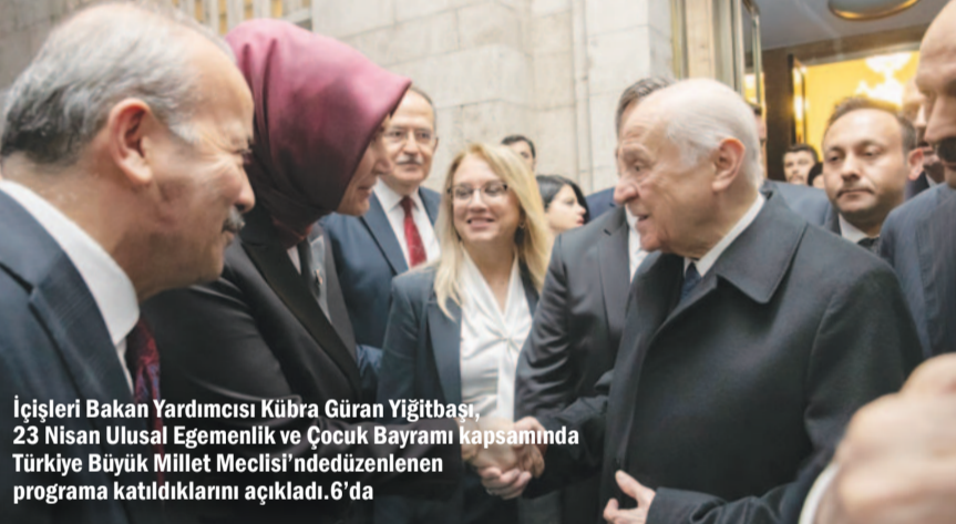
İçişleri Bakan Yardımcısı Kübra Güran Yiğitbaşı, 23 Nisan Ulusal Egemenlik ve Çocuk Bayramı kapsamında Türkiye Büyük Millet Meclisi'nde düzenlenen programa katıldıklarını açıkladı. 6'da