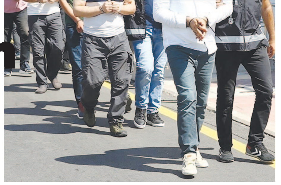
Adana Cumhuriyet Başsavcılığı koordinesinde yürütülen soruşturma kapsamında 13 Nisan’da gerçekleştirilen operasyonlarda 296 şüpheli ile 6 suça sürüklenen çocuğun yakalandığı belirtildi.