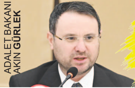
ADALET BAKANINI AKIN GÜRLEK