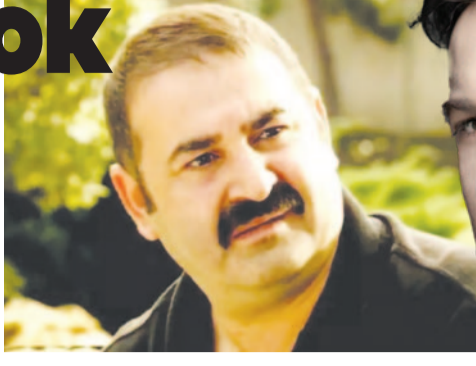
Şafak Sezer: "Tarkan'ın yaptığı Milli Takım şarkımızdan daha güzelini kimse yapamaz."

Tarkan, Şafak Sezer'in Milli Takım şarkısına ilişkin açıklamalarına sosyal medya üzerinden beğeni ile karşılık verdi