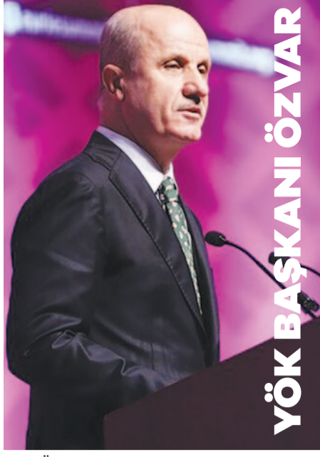
YÖK BAŞKANI ÖZVAR

Zirvenin, yükseköğretimde yeni bakış açıları geliştirmek, kurumlar arası anlamlı diyalogları teşvik etmek ve kalıcı iş birliklerini güçlendirmek için benzersiz bir platform sunduğunu kaydeden Özvar, konuşmasının ardından Avrasya Üniversiteler Birliği Başkanı Mustafa Aydın ve beraberindekilerle zirve kapsamında açılan standları ziyaret etti. Özvar, Türkiye'nin yükseköğretim vizyonunun, akademik mükemmellik, toplumsal fayda ve küresel iş birliğini birlikte ilerletecek şekilde şekillendiğini sözlerine ekledi. ■ KAYNAK AA