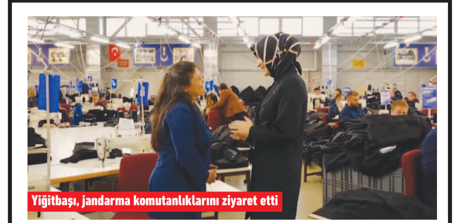
Yiğitbaşı, jandarma komutanlıklarını ziyaret etti

ODAK'a konuşan başka bir vatandaş ise farklı bir siyasi görüşe sahip olmasına rağmen mevcut durumun doğru olmadığını vurguladı. Mevcut belediye başkanına oy vermediğini belirten vatandaş, buna rağmen yapılan uygulamayı doğru bulmadığını ifade ederek, meclis üyelerinin toplantılara katılıp Ahmetpaşa'nın biriken sorunlarının çözümüne katkı sağlaması gerektiğini söyledi. Vatandaşlar, birlik ve beraberlik içinde hareket edilmesini istedi.