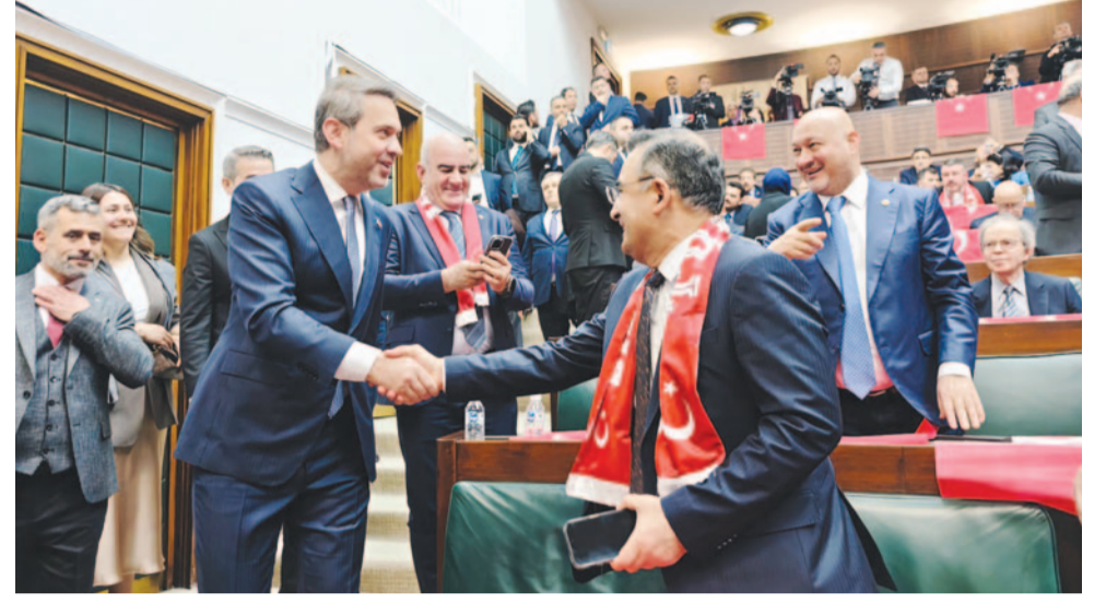
AK Parti Grup toplantısında Enerji ve Tabii Kaynaklar Bakanı Alparslan Bayraktar ile Milli Eğitim Bakanı Yusuf Tekin'in de yer aldığı görüşmede, ülke gündemine dair güncel çalışmalar ele alındı.