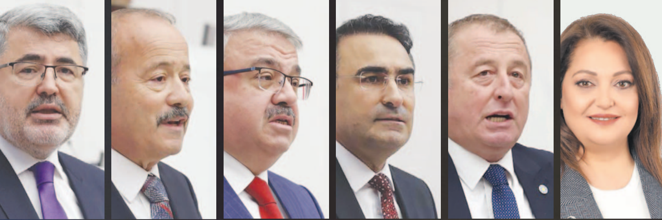
MİLLETVEKİLİ ALİ ÖZKAYA