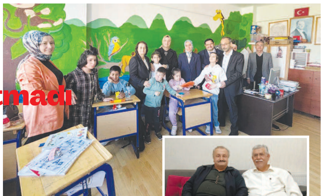
AK Parti Afyonkarahisar teşkilatı, eğitimcileri yönelik bu ziyaretlerin bundan sonra da artarak devam edeceğini belirterek, öğretmenlerin toplumun ortak geleceğini şekillendiren en değerli mihenk taşları olduğunu ifade etti.

Açıklamada, öğretmenlik mesleğinin yalnızca bilgi aktarmakla sınırlı olmadığı, aynı zamanda toplumun ahlaki ve kültürel temelini oluşturan en önemli unsurlardan biri olduğu vurgulandı. Öğretmenlerin Türkiye Yüzyılı vizyonundaki belirleyici rolüne dikkat çekildi ve eğitim camiasının fedakârlıkla sürdürdüğü çalışmalar için teşekkür edildi.