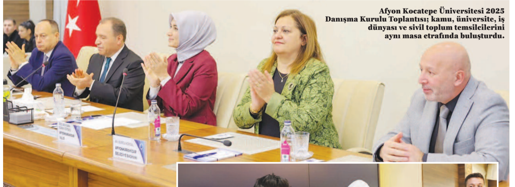
Afyon Kocatepe Üniversitesi 2025 Danışma Kurulu Toplantısı; kamu, üniversite, iş dünyası ve sivil toplum temsilcilerini aynı masa etrafında buluşturdu.