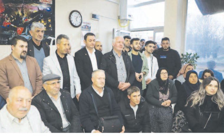
Bayram ziyaretlerinin ikinci durağı ise Sinanpaşa ilçesi oldu. Burada da vatandaşlarla bir araya gelen AK Parti heyeti, bayramın coşkusunu hemşerileriyle birlikte yaşadı. Büyüklerin hayır dualarını alan Şahin ve Arslan, çocukların bayram sevincine de ortak oldu.