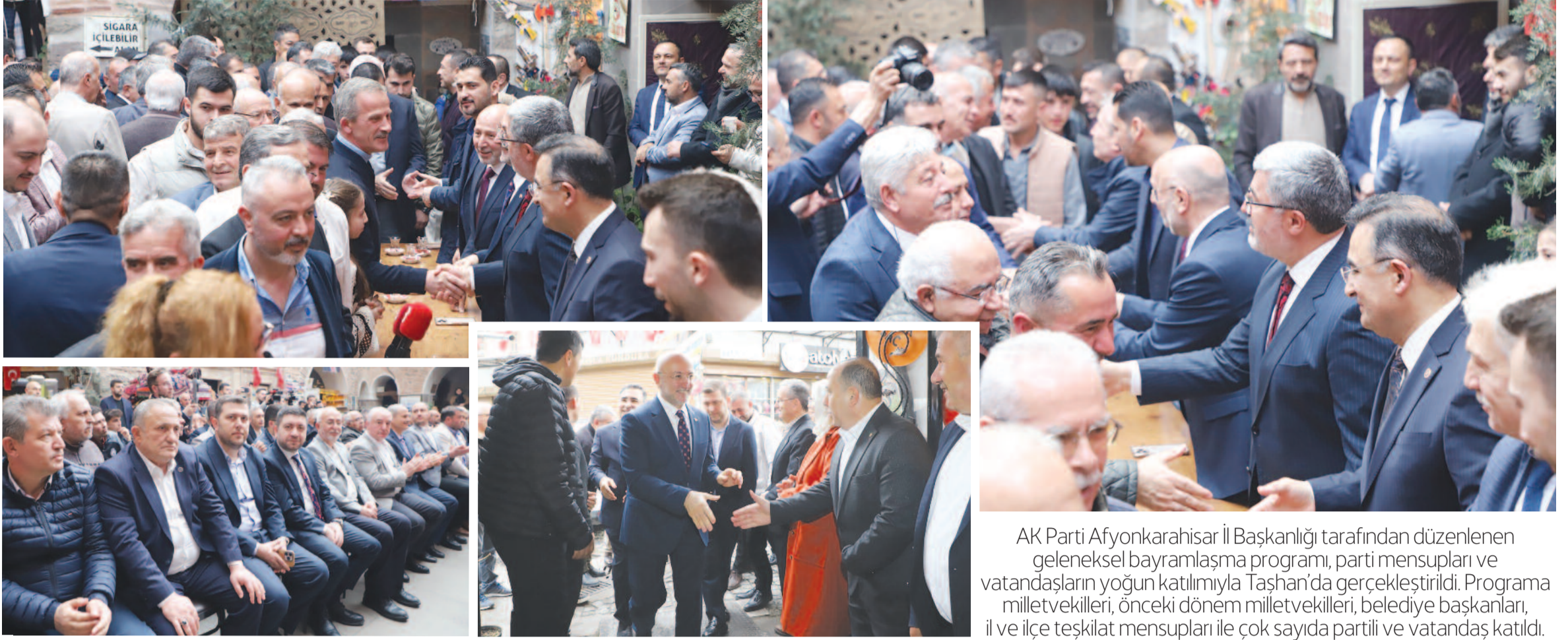
AK Parti Afyonkarahisar İl Başkanlığı tarafından düzenlenen geleneksel bayramlaşma programı, parti mensupları ve vatandaşların yoğun katılımıyla Taşhan'da gerçekleştirildi. Programa milletvekilleri, önceki dönem milletvekilleri, belediye başkanları, il ve ilçe teşkilat mensupları ile çok sayıda partili ve vatandaş katıldı.