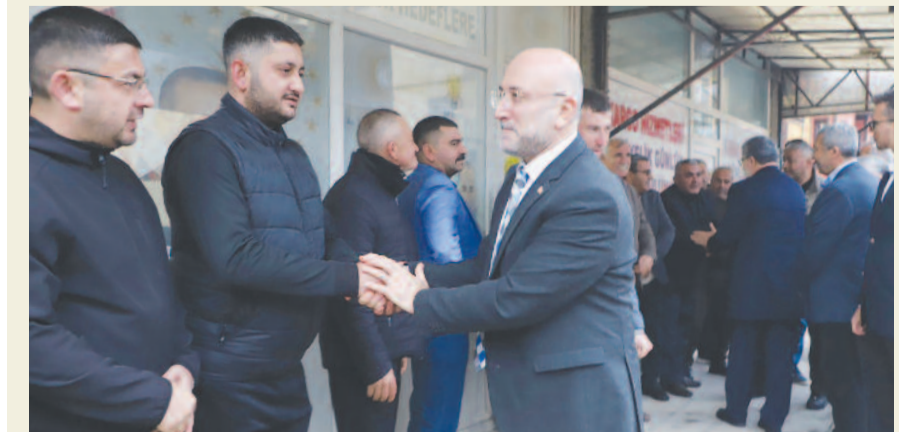
Teşkilat mensupları, tüm Afyonkarahisarlı hemşerileriyle birlikte, birlik ve beraberlik içinde nice bayramlarda buluşmayı temenni etti

Bolvadin ilçesinde düzenlenen bayramlaşma programına katılan AK Parti heyeti, burada da hemşerileriyle kucaklaştı. Büyüklerin dualarını alan, çocukların bayram sevincine ortak olan teşkilat mensupları, vatandaşlarla