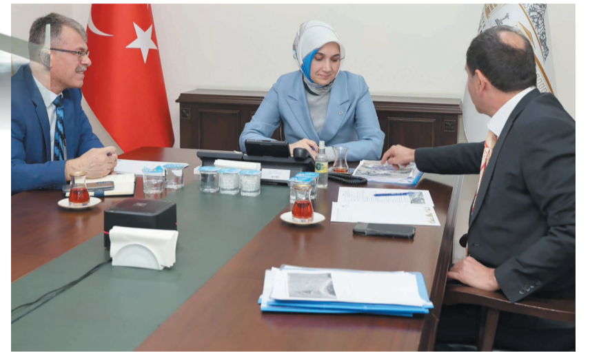
Afyonkarahisar'da sokak hayvanlarının korunması ve rehabilitasyonu konusunda yürütülen çalışmaların da değerlendirildiği toplantıya, ilgili kamu kurumları ve yetkililer de katılım sağladı.

konusunda yürütülen çalışmaların da değerlendirildiği toplantıya, ilgili kamu kurumları ve yetkililer de katılım sağladı. İçişleri Bakanı Ali Yerlikaya, toplantıda illerde yürütülecek çalışmalara dair önemli mesajlar verdi. Yetkililer, sokak hayvanlarına yönelik çözüm odaklı adımların hızla hayata geçirileceğini belirtti.