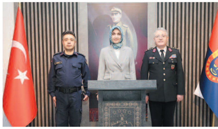
Programda, güvenlik güçlerinin görevleri ve çalışmaları hakkında bilgi alışverişinde bulunuldu. Şehit yakınları ve gazilerle yakından ilgilenen Vali Yiğitbaşı, onların taleplerini dinledi.