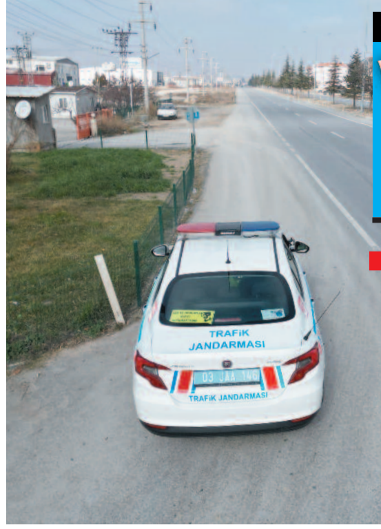
Dron destekli gerçekleştirilen denetimlerde emniyet kemeri ile sürücülerin araç kullanırken cep telefonu ile görüşme yapıp yapmadıkları kontrol ederken aynı zamanda radar uygulaması da sıklıkla yapılıyor