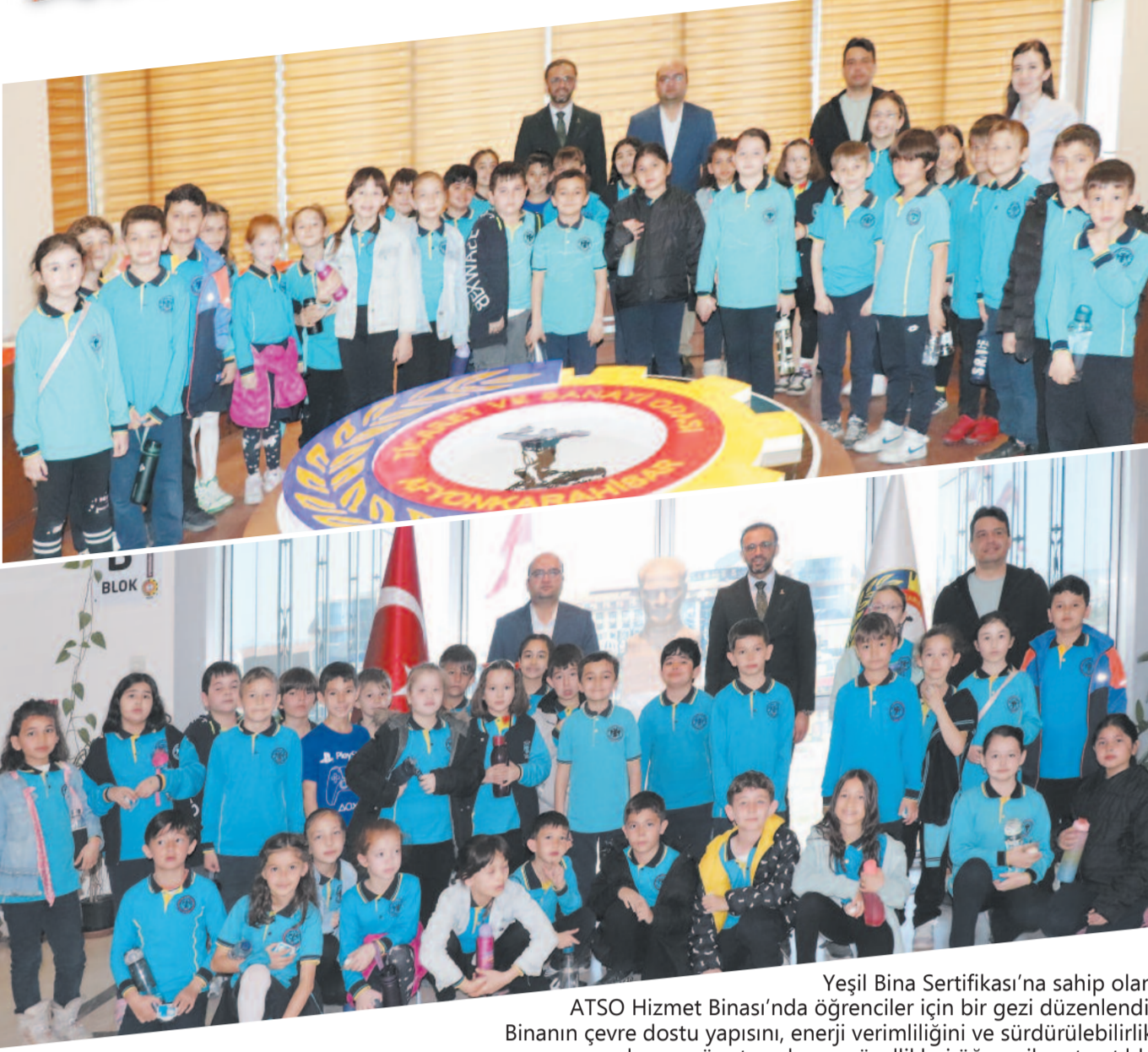
Yeşil Bina Sertifikası'na sahip olan ATSO Hizmet Binası'nda öğrenciler için bir gezi düzenlendi. Binanın çevre dostu yapısını, enerji verimliliğini ve sürdürülebilirlik esaslarına göre tasarlanmış özellikleri öğrencilere tanıtıldı.