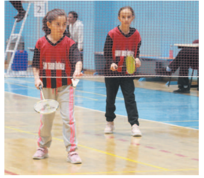
Okul Sporları Küçükler Badminton Müsabakaları, Çiğiltepe Spor Salonu'nda tamamlandı. Kız ve erkek sporcuların katıldığı turnuvada, yeteneklerini sergileyen genç badmintoncular, turnuvanın sonunda ödülleri almaya hak kazandılar