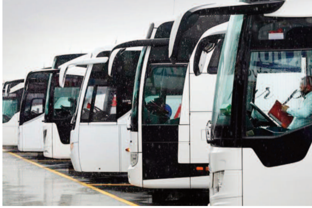
Bakan Uraloğlu, "Karayolu Taşıma Yönetmeliği'ne göre şehirlerarası biletli yolcu taşımacılığı yapan otobüs firmaları, Bakanlığımıza bildirdikleri ücret tarifeleri üzerinden yüzde 30'a kadar indirim yapabiliyor" dedi

Bakanlık oluruyla düzenleme yaptıklarını belirten Bakan Uraloğlu, yeni düzenlemenin 17 Mart Pazartesi gününden itibaren uygulanabileceğini bildirdi.