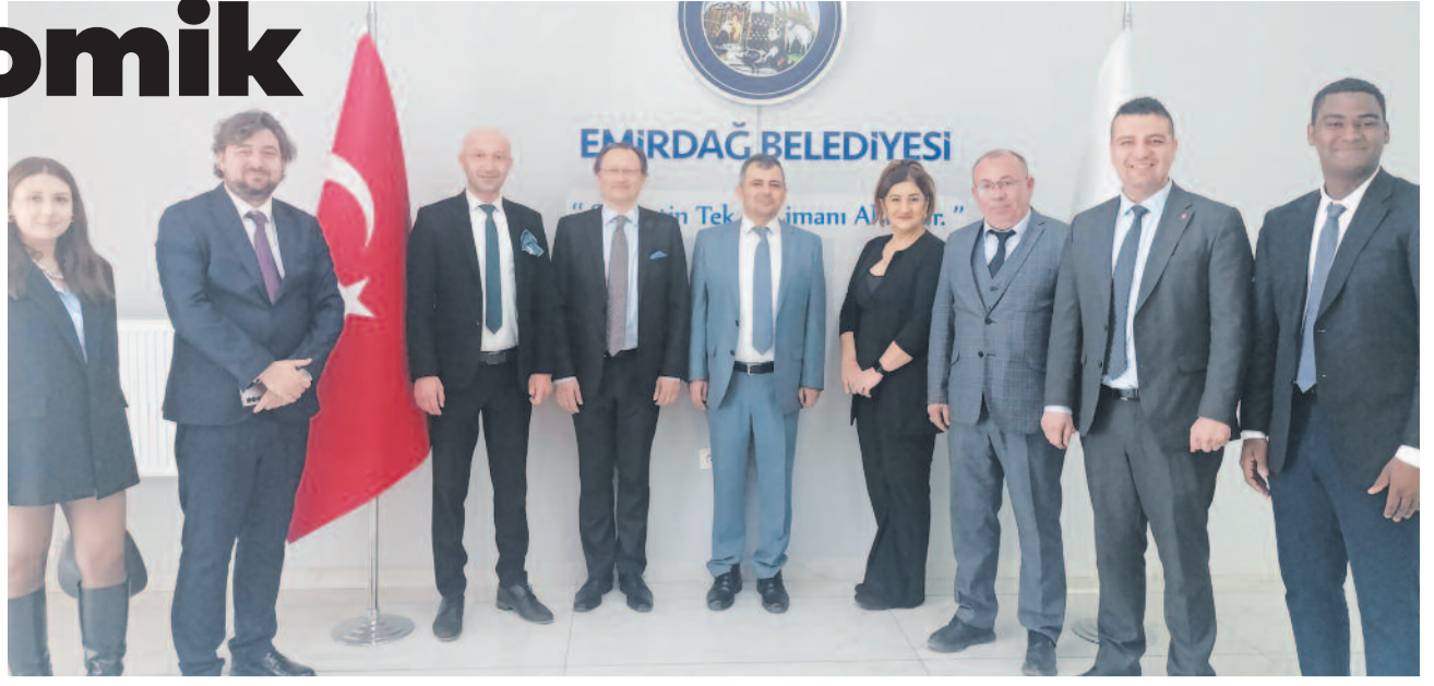
Başkan Koyuncu, ilçenin büyüyen ekonomisi ve sunduğu yatırım fırsatları hakkında detaylı bir sunum yaptı