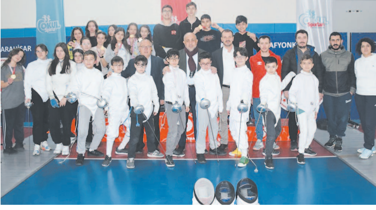
Kasapoğlu, "Eskrim, dikkat ve reflekslerin gelişmesine katkı sağlayan bir spor dalı. Bu anlamda gençlerimizi eskrim'e yönlendirmek için çalışmalarımız devam ediyor. Dereceye giren sporcularımızı ve tüm katılımcıları tebrik ediyorum." dedi.