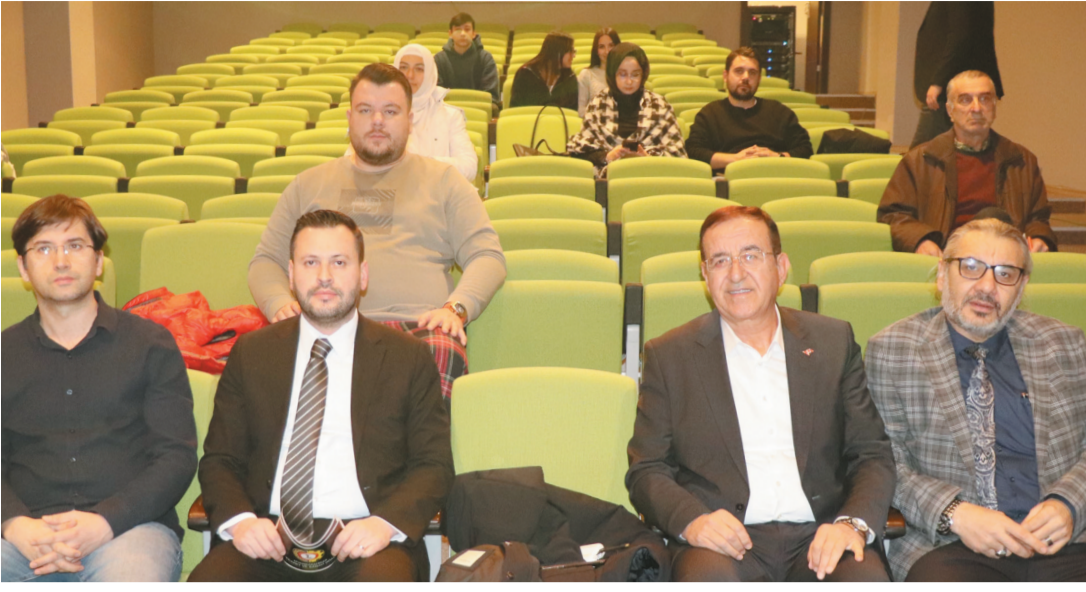
Eğitimde, büyük dil modellerinin temel çalışma prensipleri, doğal dil işleme (NLP) uygulamaları, kurumsal kullanım alanları, avantajları ve olası riskleri ele alındı