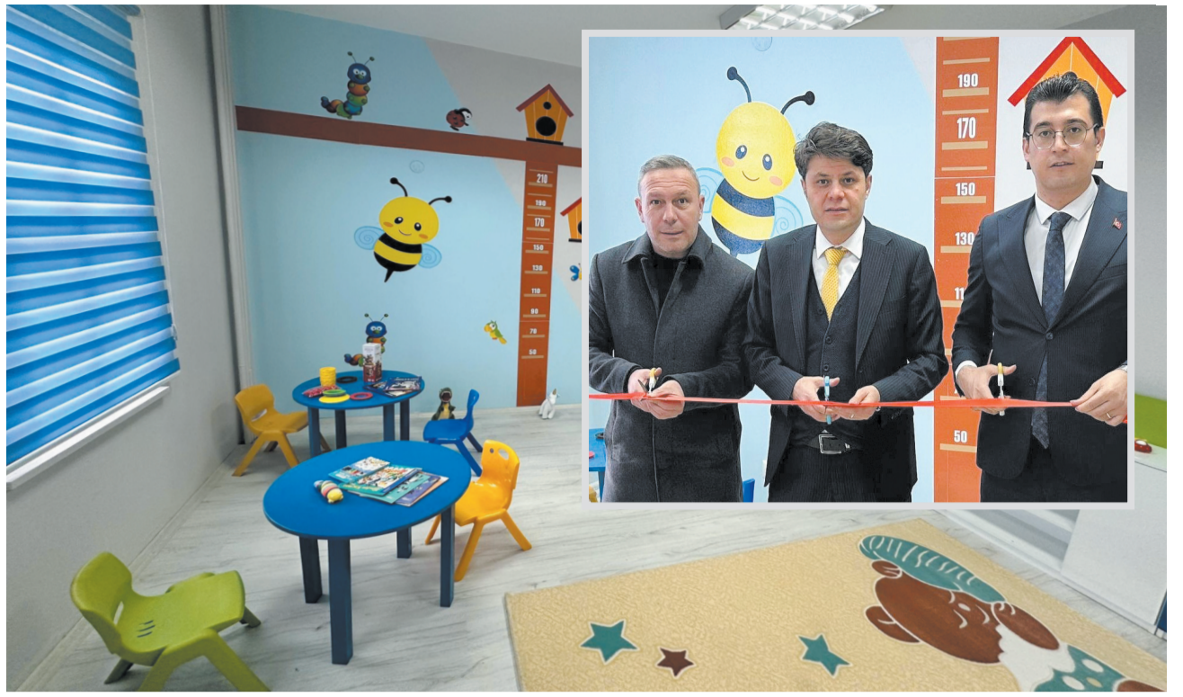
Sandıklı Adliyesinde çocukların yargılama sırasında üstün yararının korunması özellikle mağduriyeti bulunan çocukların duruşma veya diğer adli işlemler sürecinde olumsuz etkilenmemesi için adliyede vakit geçirebilmesi için çocuk odaları kuruldu