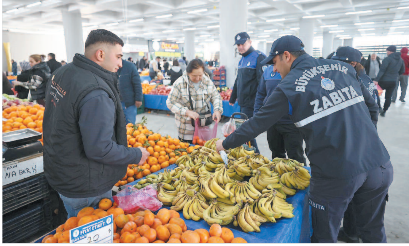
Eksiklikleri tespit edilen esnafın en kısa sürede düzenleme yapmaları için bilgilendirildiği denetimlerde, vatandaşların mağdur olmaması adına sürecin titizlikle yürütüldüğü vurgulandı