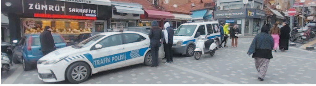
Trafik kural-larına uyulması halinde hem sürücülerin hem de yayaların güvenliği sağlanmış olacak. Vatandaşlardan, kask takma ve plaka kullanımı konusunda duyarlı olmaları bekleniyor.

Kütahya'nın Tavşanlı ilçesi İlçe Emniyet Müdürlüğü Trafik Büro Amirliği, motosiklet sürücülerine yönelik yoğun denetimler gerçekleştirdi