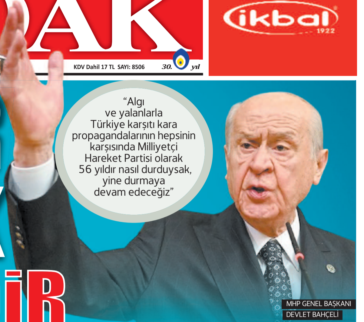
MHP GENEL BAŞKANI DEVLET BAHÇELİ

“Algı ve yalanlarla Türkiye karşıtı kara propagandalarının hepsinin karşısında Milliyetçi Hareket Partisi olarak 56 yıldır nasıl durduysak, yine durmaya devam edeceğiz”