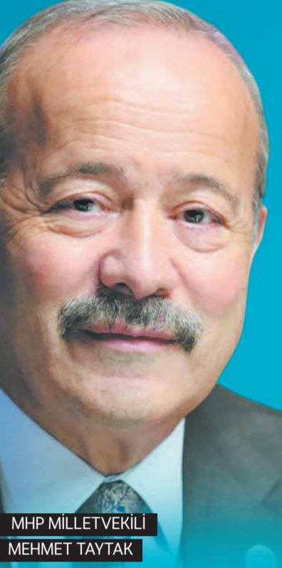
MHP MİLLETVEKİLİ MEHMET TAYTAK