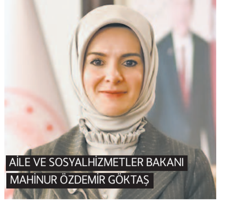
AILE VE SOSYAL HİZMETLER BAKANI MAHİNUR ÖZDEMİR GÖKTAŞ

Aile ve Sosyal Hizmetler Bakanı Mahinur Özdemir Göktaş, sosyal medya düzenlemesinde "yaş sınırı" noktasında kademeli bir düzenleme üzerinde çalıştıklarını belirterek, 13 yaşa kadar olan çocuklar için ayrı, 13-16 yaş grubundaki çocuklar için ayrı olmak üzere, 2 farklı kademede çalışma yürütüldüğünü söyledi