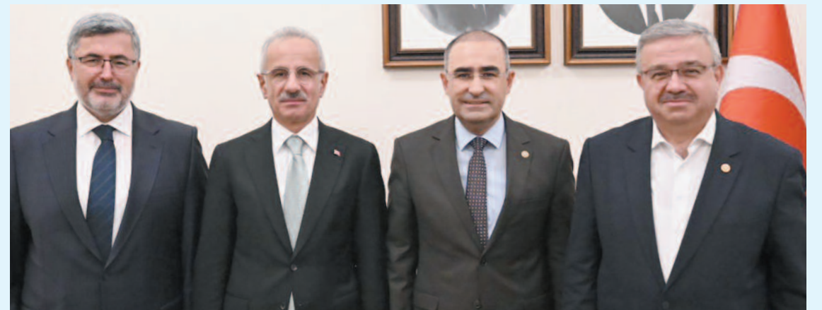
AK Parti Milletvekilleri Ali Özkaya, İbrahim Yurdunuseven ile Hasan Arslan 1 Ekin 2024 tarihinde Ulaştırma ve Altyapı Bakanı Abdülkadir Uraloğlu ile görüşerek yol konusunda destek talep etmişlerdi.