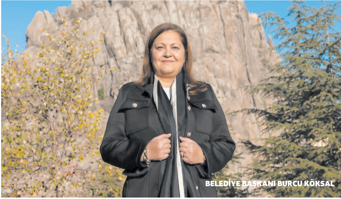
BELEDİYE BAŞKANI BURCU KÖKSAL

Konuşmasında, eğitimin çocukların hayallerine ulaşmasındaki en güçlü araç olduğunu vurgulayan Başkan Köksal, şu ifadeleri kullandı: "Af-