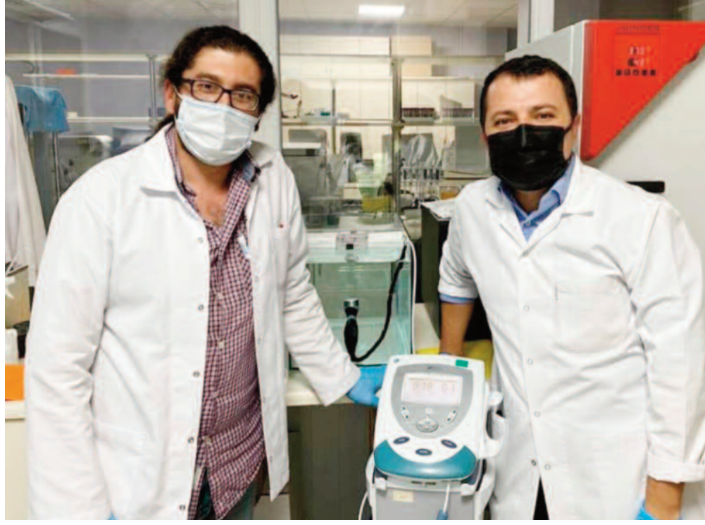
AFSÜ Bilimsel Araştırma Projeleri Koordinatörlüğü (BAP) tarafından desteklenen söz konusu çalışmadan üretilen makale de "Journal of Cellular and Molecular Medicine" ile literatüre kazandırıldı.