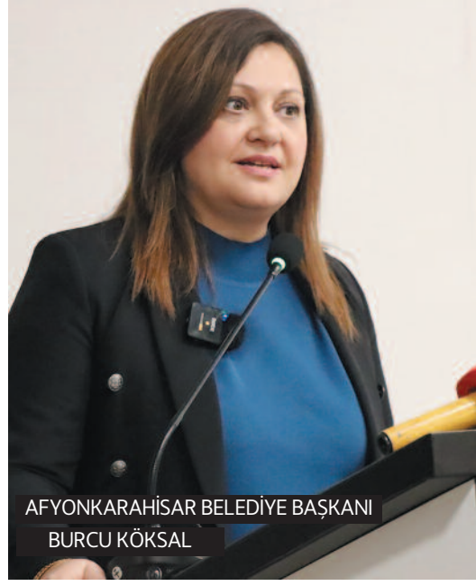
AFYONKARAHİSAR BELEDİYE BAŞKANI BURCU KÖKSAL