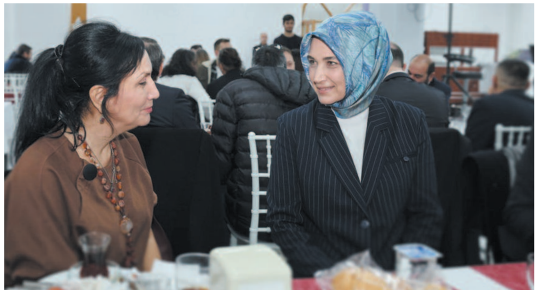
Vali Yiğitbaşı programda tüm basın mensuplarıyla ayrı ayrı bir araya gelerek hem Gazeteciler Günü'nü kutladı hem de çalışmalarını üzerine kısa süreli sohbet etti. Gazetecilerin taleplerini ve önerilerini de dinleyen Vali Yiğitbaşı, meslek hayatlarında başarılar diledi.

■ 10 Ocak'ta Çalışan Gazeteciler Günü ile birlikte İdareciler Günü'nün de kutlandığını hatırlatan ve tüm basın mensuplarıyla birlikte tüm idarecilerin de gününü kutlayan Vali Doç. Dr. Kübra Güran Yiğitbaşı, "Medya haber alma ve doğru bilgiye ulaşma bağlamında demokrasinin vazgeçilmez bir unsurudur. İlkeli ve ahlaki sorumluluk çerçevesinde görevlerini yerine getirmeye gayret eden gazetecilerimiz, tüm toplum için devlet ve millet için büyük ve önemli bir görevi ifa etmektedirler. Asıl mesleği kamuoyunu bilgilendirme ve toplumsal farkındalık oluşturma gibi son derece kritik bir sorumluluğu üstlenen gazetecilerimizde gelişen teknoloji ve bilginin yayılma hızının artması doğru habercilik anlayışının kıymetini çok daha fazla ön plana çıkarmıştır" dedi.