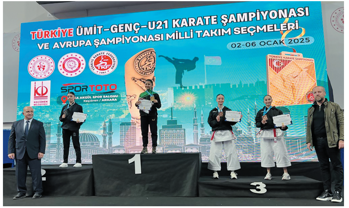
Afyonkarahisar Gençlik ve Spor İl Müdürü İsmail Hakkı Kasapoğlu, sporcuların elde ettiği dereceler nedeniyle duyduğu memnuniyeti dile getirdi

E-Devlet üzerinden başvuru yapamayan vatandaşlar için Hocalar Gençlik ve Spor İlçe Müdürlüğü tarafından şahsen başvuru yapma imkânı sağlanıyor. Vatandaşlar, Hocalar İlçe Müdürlüğü'ne gelerek, kayıtlarını yapabilecekler. Hocalar'daki masa tenisi turnuvasının tarihleri ve detaylı katılım şartları da kısa bir süre içinde duyurulacak. Turnuvaya katılacak sporcuların, belirlenen şartlara uygun olması gerektiği gibi, yaş sınırları ve diğer gereklilikler de göz önünde bulundurulacak. Hocalar Gençlik ve Spor İlçe Müdürlüğü, turnuvaya katılım için gerekli tüm bilgilere başvuru yapan sporculara ulaşarak detaylı bilgi verecek.