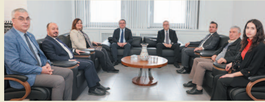
CHP İl Başkanı Faruk Duha Erhan, CHP Uşak Milletvekili Ali Karaoba, CHP Aydın Milletvekili Evrim Karakoz ve Uşak Merkez İlçe Başkanı Uğur Dümen ile birlikte Belediye Başkanı Burcu Köksal'ı ziyaret ettiler.