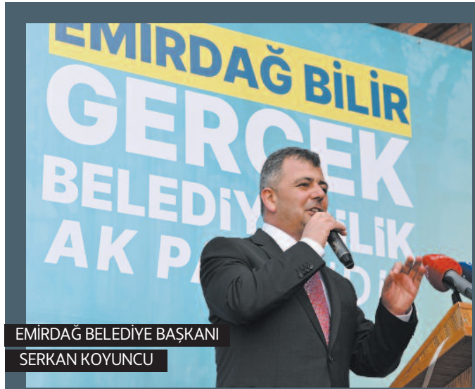
EMİRDAĞ BELEDİYE BAŞKANI SERKAN KOYUNCU