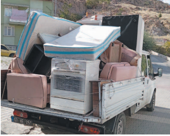
Afyonkarahisar Belediyesi'nin, son 3 ayda binden fazla aileye çeşitli destekler sağladığı ve eğitim ile beslenme yardımları konusunda da çalışmalarını sürdürdüğü belirtildi