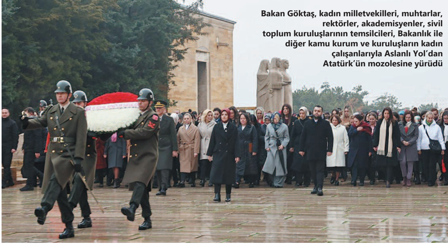
Bakan Göktaş, kadın milletvekilleri, muhtarlar, rektörler, akademisyenler, sivil toplum kuruluşlarının temsilcileri, Bakanlık ile diğer kamu kurum ve kuruluşların kadın çalışanlarıyla Aslanlı Yol'dan Atatürk'ün mozolesine yürüdü

Bakan Göktaş, "Ülkemiz kadınları, kadim geçmişimizi, yüksek inanç ve değerlerimizi, bilim ve teknolojinin imkânlarıyla harmanlayarak, medeniyetimizi ihya etmeyi sürdürecektir. "Güçlü Kadın, Güçlü Türkiye" anlayışıyla gelecek nesillere ilham veren, öncü kadınlarla dolu bir Türkiye'yi hep birlikte inşa edeceğiz"