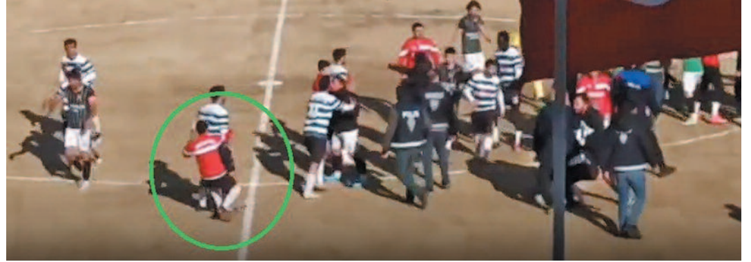
Demirçevre Spor futbolcularının serbest vuruş öncesi topu alarak zaman geçirmeye çalıştığını kızan Dinar Belediyespor hakeme ve futbolculara tepki gösterdi

İki takım futbolcuları arasındaki sözlü atışma kavgaya dönüşürken, futbolcular bir anda tekne ve yumruklarla birbirlerine girdiler. Futbolcuları ayırmak için 2 takımın teknik ekibi, yöneticileri ve polis sahaya girdi. Polis ve yöneticilerin kavgayı ayırmasının ardından hakem, Dinar Belediye Spor ile Demirçevre Spor'un sahadaki 5'er, yedek kulübesindeki 2'şer futbolcusuna kırmızı kart gösterdi. Liderlik mücadelesi veren 2 takımın maçı, skandal görüntülerin yaşanması üzerine tatil edildi. Öte yandan olayların ardından polis tarafından inceleme başlatıldı. İHA