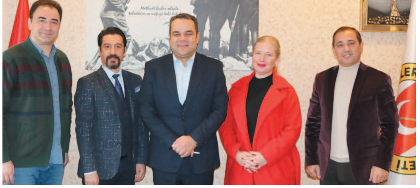
Protokolde en çok dikkat çeken madde, Afyonkarahisar Gazeteciler Cemiyeti üyelerinin ve personelinin çocuklarının Özel Girne Koleji Afyon Kampüsü'nde alacakları eğitim ücretlerinde yüzde 25 indirim uygulanmasını öngören düzenleme oldu.