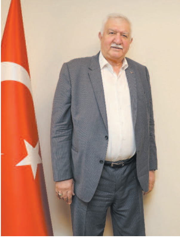
Başkan Alim-oğlu, bu başarılarını 2025 yılında sürdürülebilir kılmak için görev sahasındaki illerde "Maden Sektörel Strateji Toplantıları" düzenleme kararı aldıklarını, ilk iki toplantının aralık ayının ikinci yarısında Denizli ve Muğla'da olacağını kaydetti

EMİB, maden sektörüyle finansman sektörünü Denizli ve Muğla'da bir araya getirecek. Ege madenciler, 2025 yılı stratejilerini belirlemek ve için Maden Sektörel Strateji Toplantılarında bir araya gelecek