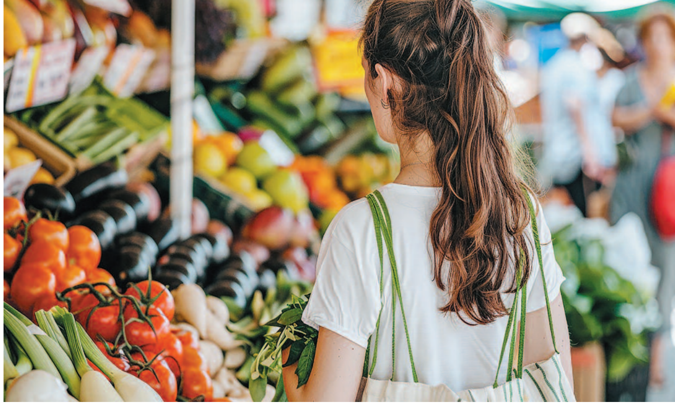
Yapılan açıklamada, "Ekonomik krizden çıkış için çalışanlardan özveri beklenmektedir. Daha önce de belirttiğimiz üzere ücretli çalışanlar enflasyonun nedeni değil mağdurdur. Ülkemizde gelir ve servet eşitsizliğini dengeleyecek adil bir vergi sistemi ile bütüncül sosyal politikalara ihtiyaç duyulmaktadır"