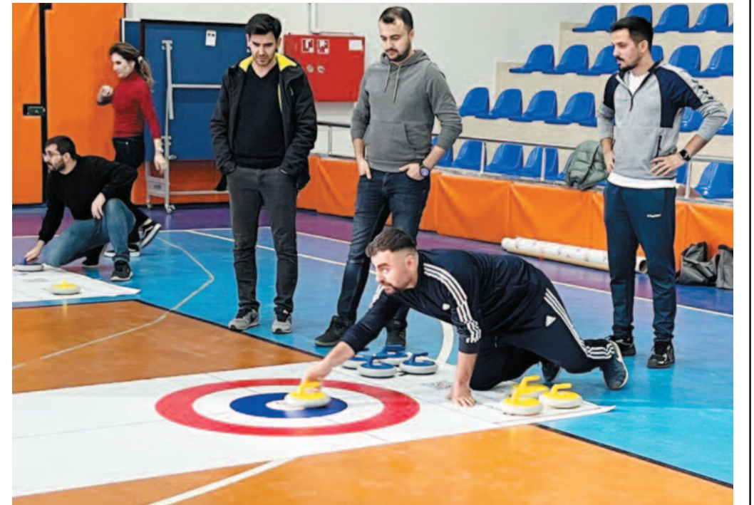
İlçe genelinde eğitim veren okullardan yaklaşık 70 öğretmenin katıldığı etkinlik, sporcular arasında tatlı bir rekabet ortamı oluşturdu.

Ortaokulu ve Serban İlkokulu öğretmenlerinin oluşturduğu takımlar, turnuvada üstün performans sergileyerek sırasıyla birinci, ikinci ve üçüncü oldu. Dereceye giren takımlara ödülleri düzenlenen ödül töreni ile takdim edildi. HABER UĞUR BALABAN