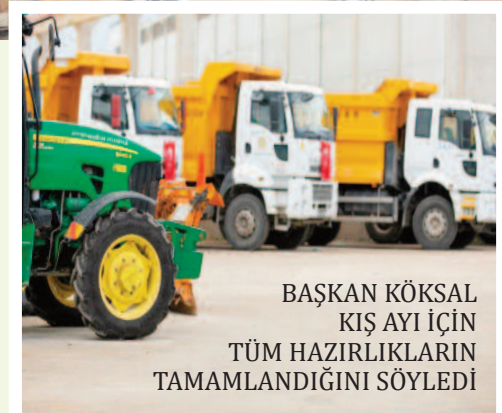
BAŞKAN KÖKSAL KIŞ AYI İÇİN TÜM HAZIRLIKLARIN TAMAMLANDIĞINI SÖYLEDİ

Afyonkarahisar Belediyesi, karla mücadele için 100 araçlık donanımlı bir filoyu hizmete sundu. Filoda, 19 ağır iş makinesi, 15 kamyon, 9 tuzlama ve kar küreme aracı, 4 solüsyon tankı, 4 traktör ve diğer tüm araçlar görev yapmaya hazır du-