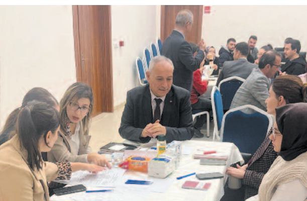
İntihar ve Çocuk İstismar Vakalarında Güçlendirilmiş Sosyal Hizmet Müdahalesi başlıkları ele alındı. Mevcut sorunların ortaya konularak olası risklerin belirlendiği çalışmalarda kısa, orta ve uzun vadede uygulanabilir çözüm önerilerin değerlendirildi