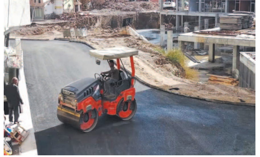
Belediye Başkanı Aynacı, ilçenin dört bir yanında devam eden sıcak asfalt çalışmalarına ilişkin yaptığı açıklamada, toplam da 15 milyon TL'lik bir asfaltlama çalışması gerçekleştirdiklerini ifade etti.