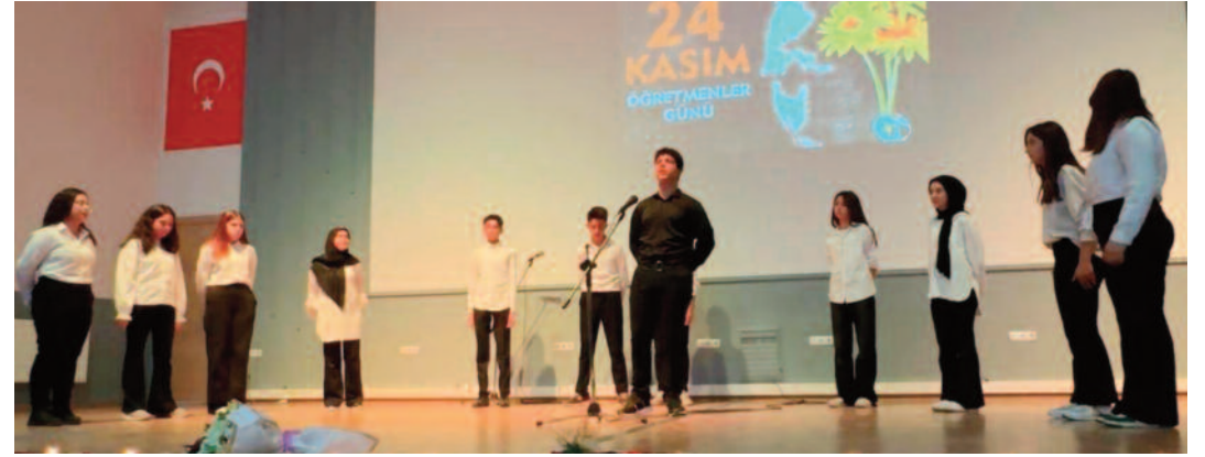
Öğretmeni anlatan şiirler okundu, Oraterya sonrasında öğrenciler tarafından çokertme oyunu oynandı

durdurarak arama yaptı. Şüphelinin kaldığı tavuk çiftliğine de baskın düzenleyen ekipler ruhsatsız tabanca, 4 ruhsatsız av tüfeği, 2 adet bütünlüğü bozulmuş tabancaya ait parçalar ve 3 adet uyuşturucu kullanma aparatı ele geçirildi. Olayın ardından gözaltına alınan S.K.'nın işlemlerinin sürdüğü bildirildi. HABER MERKEZİ