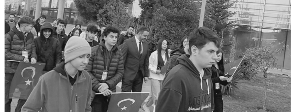
"Kahramanların İzinde Anadolu" programı ile çocuklar, 14-16 Kasım tarihlerinde Çanakkale, Bursa ve Eskişehir'de tarihi mekanları ziyaret edecek.