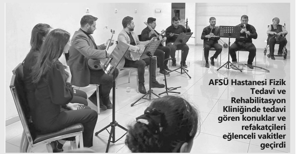
AFSÜ Hastanesi Fizik Tedavi ve Rehabilitasyon Kliniğinde tedavi gören konuklar ve refakatçileri eğlenceli vakitler geçirdi