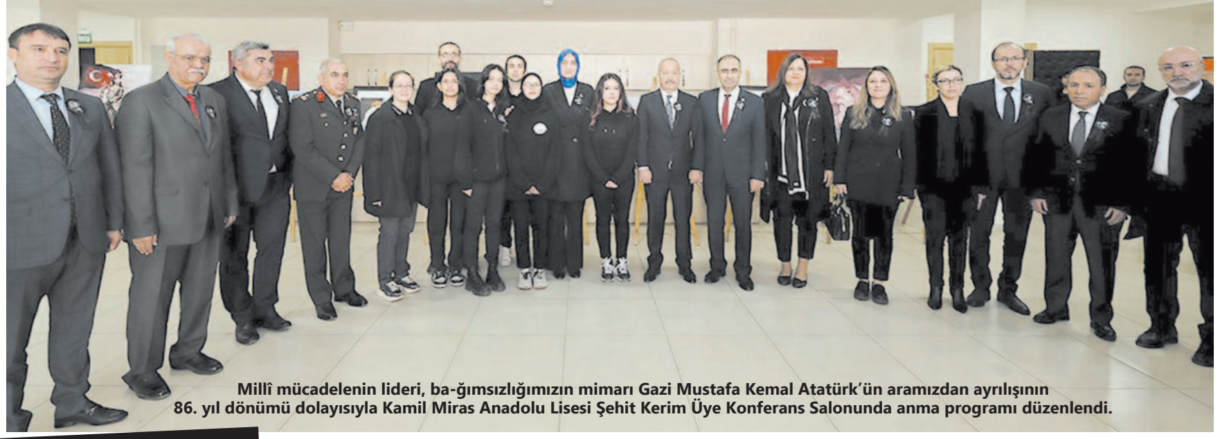
Millî mücadelenin lideri, ba-ğimsizliğimizin mimarı Gazi Mustafa Kemal Atatürk'ün aramızdan ayrılışının 86. yıl dönümü dolayısıyla Kamil Miras Anadolu Lisesi Şehit Kerim Üye Konferans Salonunda anma programı düzenlendi.