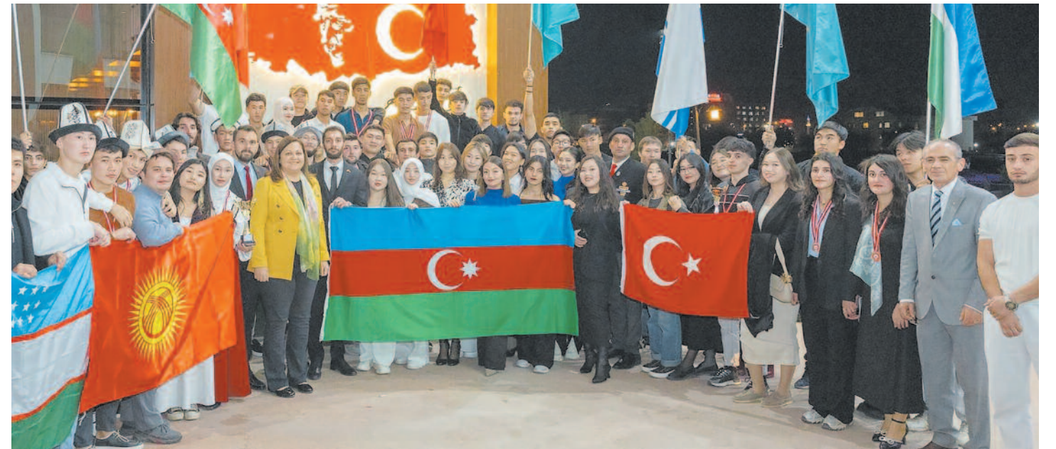
Başkan Köksal, Azerbaycan'ın ordusunu ve aziz şehitlerini rahmetle anarak tüm Türk Dünyası için birlik ve beraberlik dileklerini dile getirdi.