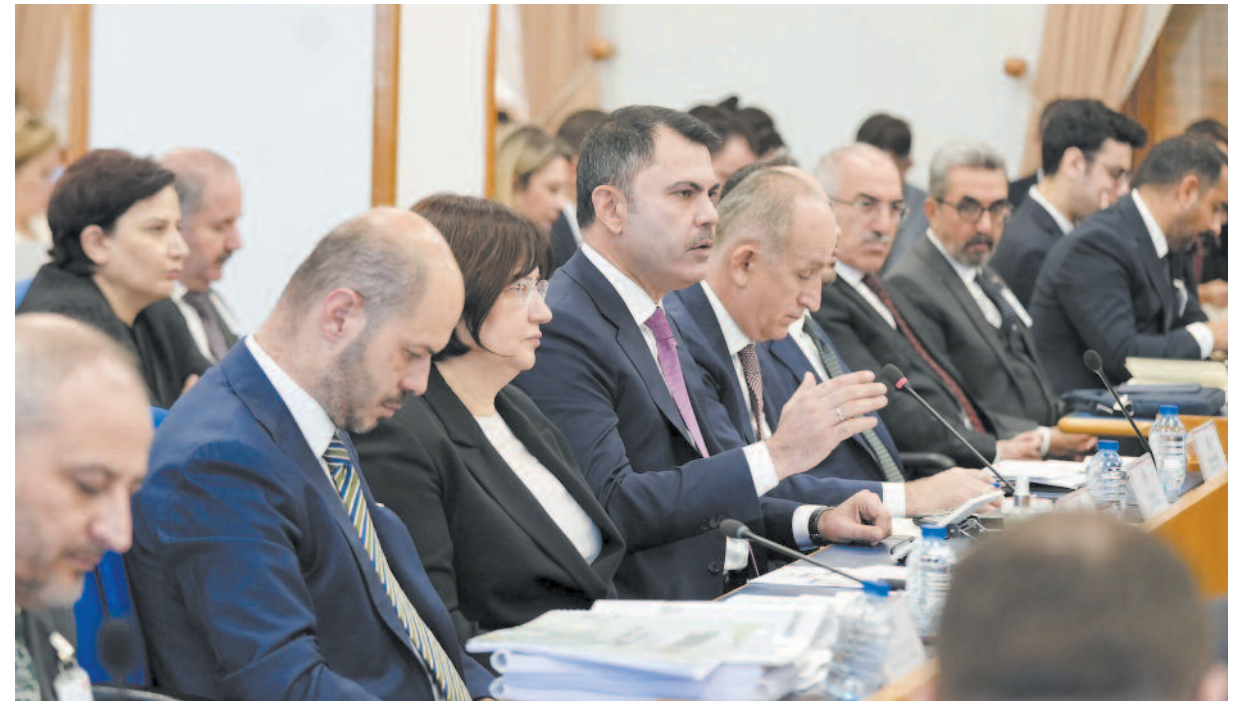
Milletvekili Taytak, "Seçim bölgem Afyonkarahisar ilimiz, ilçelerimiz ve beldelerimizde 2340 toplu konutun ihalesi 4 Aralık 2024 tarihinde yapılacaktır. Ben ülkemiz ve Afyonkarahisarlı hemşerilerim adına şahsınıza ve ekibinize teşekkür ediyorum" dedi