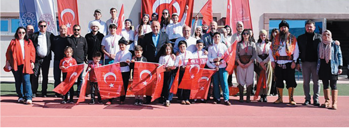
Katılımcılar, tarihi okçuluk kıyafetleri içinde yarışarak geleneksel sporun özünü yaşarken, tribünlerde heyecan ve gurur dolu anlar yaşandı

CUMHURİYET'İN 101. YILINA özel olarak düzenlenen Geleneksel Türk Okçuluğu Cumhuriyet Kupası, Afyonkarahisar Atletizm Pistinde yoğun katılımı düzenlendi