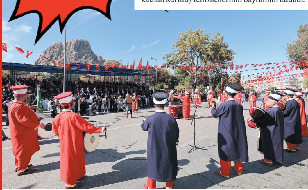
29 Ekim Cumhuriyet Bayramı'nın 101. yıl dönümü Afyonkarahisar'da da törenle kutlandı. Zafer Meydanında yapılan törenlerde büyük bir coşku ve gurur vardı. 8. sayfada