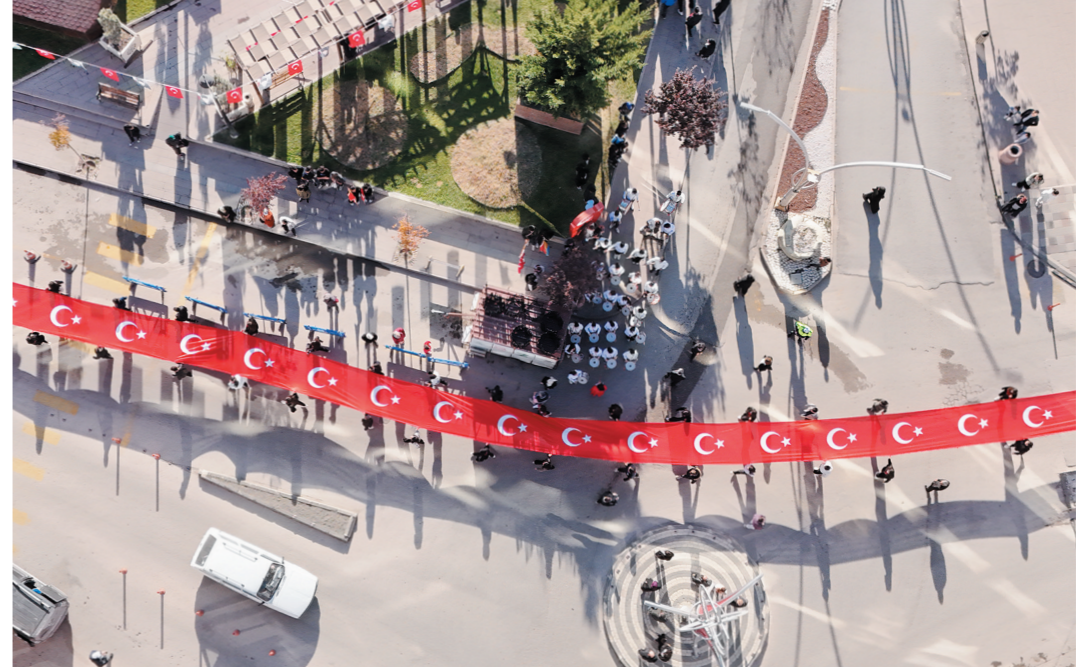
Bando ekibinin geçiş töreninde, Cumhuriyetimizin 101. yılına özel olarak hazırlanan 101 metre uzunluğundaki Türk Bayrağı taşınarak izleyicilerden büyük alkış aldı.