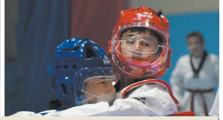
Dinar SK, Dazkırı SK, Erkmen SK, Aktif Yaşam SK, Taşoluk SK, Şuhut SK, Gençlik SK, Karahisar SK, İscehisar SK ve ferdi sporcuların da yer aldığı turnuvada, kulüplerin yetenekli sporcuları ödül aldı.