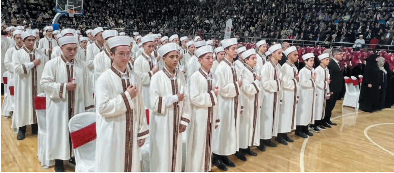
Hafızlık icazet merasimi yoğun bir katılımıla gerçekleşti

Ne mutlu Kur'an'ı hâfızasına nakşeden hafızlara. Afyonkarahisar'ımızın Kur'an aşığı 201 Hafızımızın İl Müftülüğümüz tarafından düzenlenen Hafızlık İcazet Merasimi'ne katılarak kutlu vazifelerine şahitlik ettik" ifadelerini kullandı. Afyonkarahisar'da İslam kültürünün önemli bir unsuru olan hafızlık geleneğinin yaşatılması adına yapılan etkinlikte, genç hafızlar hem protokol üyeleri hem de vatandaşlar tarafından tebrik edildi. Hafızlık İcazet Merasimi, toplumsal dayanışmayı güçlendirerek büyük bir manevi coşku ile tamamlandı.