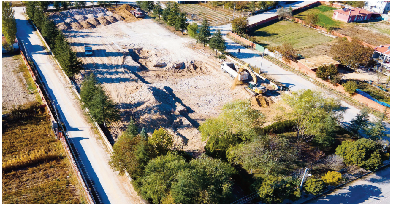
Altuntaş, "Hayirseverimiz Yılanıcı Ailemize ilçemiz eğitime vermiş oldukları bu önemli destekten dolayı sonsuz teşekkürlerimi sunuyorum. Çobanlar'ımıza hayırlı olsun" dedi