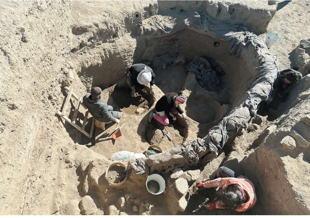
Koçak, kazıda bulunan silo ile mühürler ve damga mühür baskılarının Üçhöyük yerleşiminin idari bir merkez olduğunu kanıtlar nitelikte olduğunu dile getirdi.