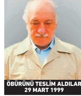
ÖBÜRÜNÜ TESLİM ALDILAR 29 MART 1999