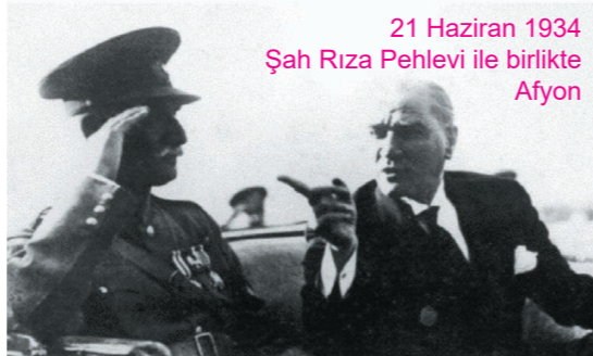
21 Haziran 1934 Şah Rıza Pehlevi ile birlikte Afyon