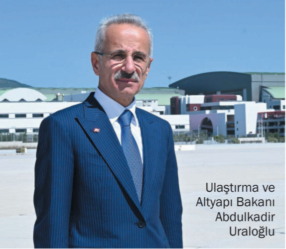
Ulaştırma ve Altyapı Bakanı Abdulkadir Uraloğlu