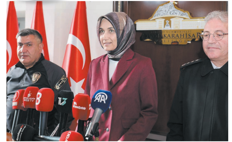
VALİ YİĞİTBAŞI, BELLİ ARALIKLARLA İLİMİZDE YÜRÜTÜLEN ÇALIŞMALARINI BASIN İLE PAYLAŞIYOR

Son bir ay içerisinde Emniyet ve Jandarma ekipleri tarafından yapılan operasyonlarda 3 milyon 649 bin 880 adet dolu makaron, 2 milyon 933 bin 100 adet boş makaron, 162,85 litre kaçak alkol ele geçirildi.