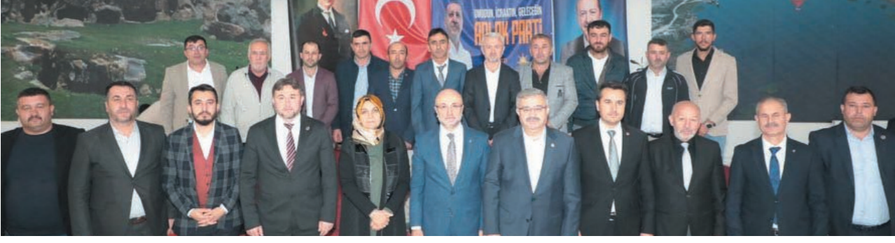
Milletvekili Yurdunuseven, "Eser ve hizmet siyasetiyle Cumhurbaşkanımız Sayın Recep Tayyip Erdoğan'ı öncülüğünde tüm teşkilatlarımızla birlikte milletimize hizmet yolculuğuna devam ediyoruz"