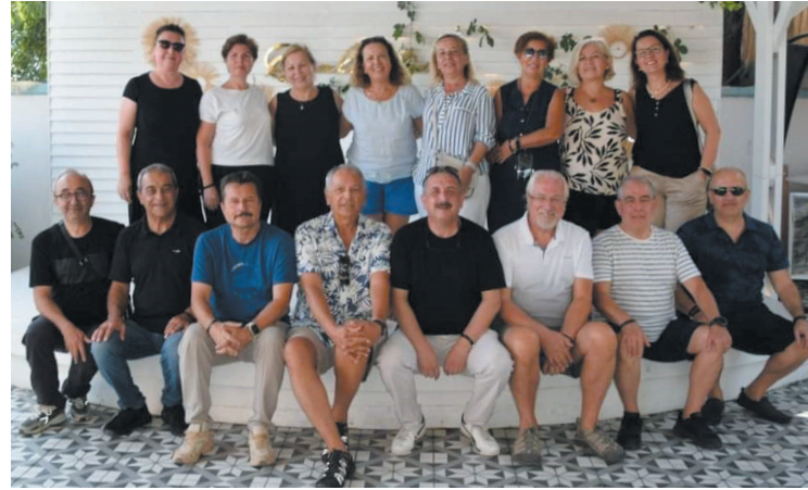
41 yıl aranın ardından, mezunlar ve dönemin öğretmenleri ile 100'den fazla kişi ilk defa toplandıktan sonra, 1980 yılı mezunları bu yıl Antalya Kemer'deki dört günlük program kapsamında yeniden bir araya gelmenin heyecanını yaşadı.