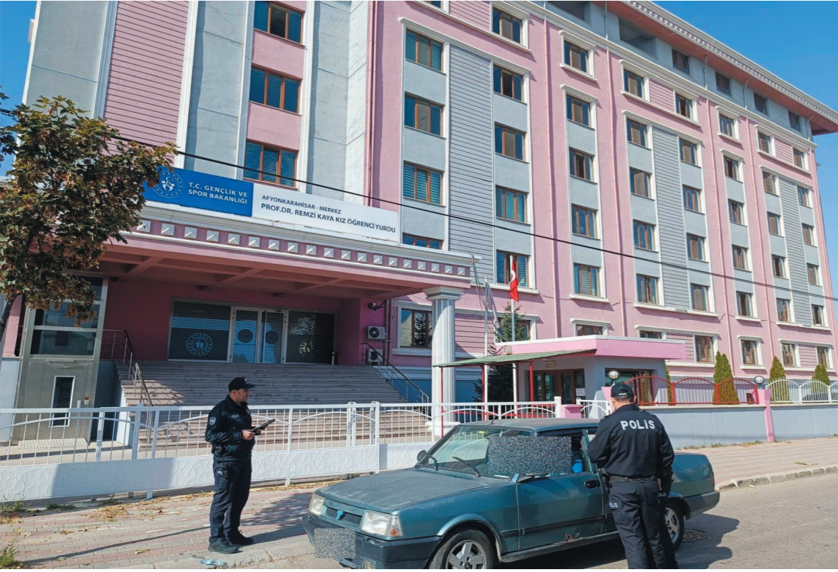
Afyonkarahisar İl Emniyet Müdürlüğü yetkilileri, kız öğrenci yurtları çevresinde güvenlik ve asayiş uygulamalarının titizlikle devam edeceğini belirtti.