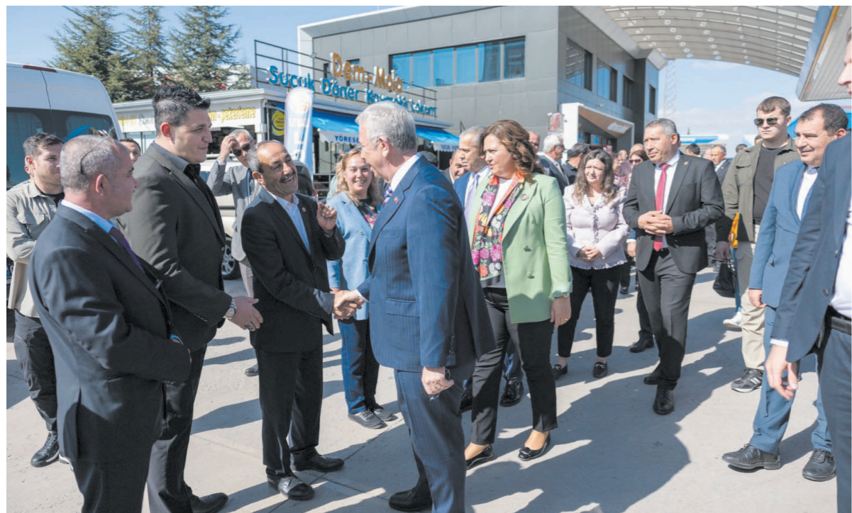
Afyonkarahisarlı vatandaşlar, Ankara Büyükşehir Belediye Başkanı Mansur Yavaş'a büyük ilgi gösterdiler.