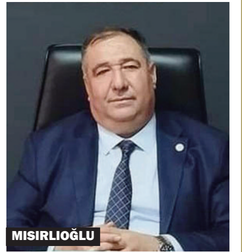
Mısırlıoğlu, İYİ Parti Genel Başkanı Müsavat Dervişoğlu'nun nüfus sayımı çağrısının ivedilikle karşılık bulması gerektiğini ifade etti

"Genel Başkanımız Sayın Müsavat Dervişoğlu, ülkemizdeki kaçakların tespiti için çok mantıklı bir çağrıda bulunmuş, kapalı nüfus sayımı teklif etmiştir. Bu teklifin acilen karşılık bulması gerektiği kanaatindeyim. Onlarca suç kaydı ile sokaklarda rahatça gezebilen şahıslar yüzünden hiçbirimizin can güvenliği kalmadı. 22 yılda ülkenin adalet sistemini çökertenler bu ülkeye bunu borçlular"