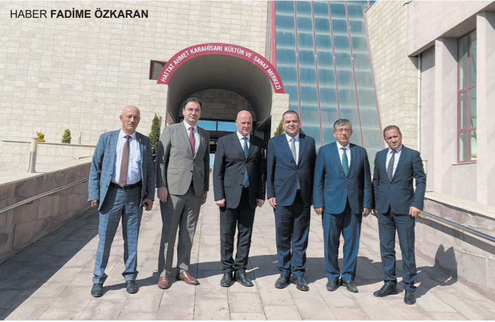
HABER FADİME ÖZKARAN

rağmen esnafa yönelik bir adım atmayan iktidar, esnafın feryadını duymadığı gibi esnafın sesini kesmeye çalışmaktadır. Bu da esnafın sesi olan oda başkanına yapılan baskılardan bir kez daha görülmüştür" dedi. İktidarın, çiftçiye, işçiye ve esnafa kör ve sağır davrandığını dile getiren Milletvekili Olgun, sivil toplum örgütleri üzerindeki baskının biran önce kaldırılmasını istedi. Milletvekili Olgun; "Yaşadığımız şatafatlı yaşamlarınız sesini kesmeye çalıştığınız esnafın vergilerinden sağlıyorsunuz. Her alanda yapmadığınız savurganlık kalmadı. Hizmet edecek olanları 'tasarruf tedbiri' adı altında elini kolunu bağlarken kendi yaşantınızdan ve savurganlığınızdan taviz vermiyorsunuz. Esnafın sesi olan oda başkanı, 'gidişat kötü, giderek sesine kötülüyor' demesini bile kabullenemiyorsunuz. Hep kendi bildiğini yaptınız, esnafa kör ve sağır oldunuz. Bu gidişat da ilk önce sizi götürülecektir. Unutmayın ve hiç de çırpınmayın... Gidiyorsunuz" diye konuştu. İYİ Parti Genel Başkan Yardımcısı ve Afyonkarahisar Milletvekili Hakan Şeref Olgun, oda başkanlarına çağrıda bulunarak, siyasete karışmalarını ve iktidarın kuklası olmamaya davet etti. HABER ALİ OSMAN OKŞAR