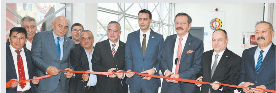
İncehisar Temsilciliği Eylül 2022 yılında hizmete açıldı

Afyonkarahisar Ticaret ve Sanayi Odası, üyelerine daha hızlı ve verimli hizmet sunabilmek amacıyla İncehisar Temsilciliği'nde ihracat evraklarının satışı ve onaylama işlemlerine başladığını duyurdu