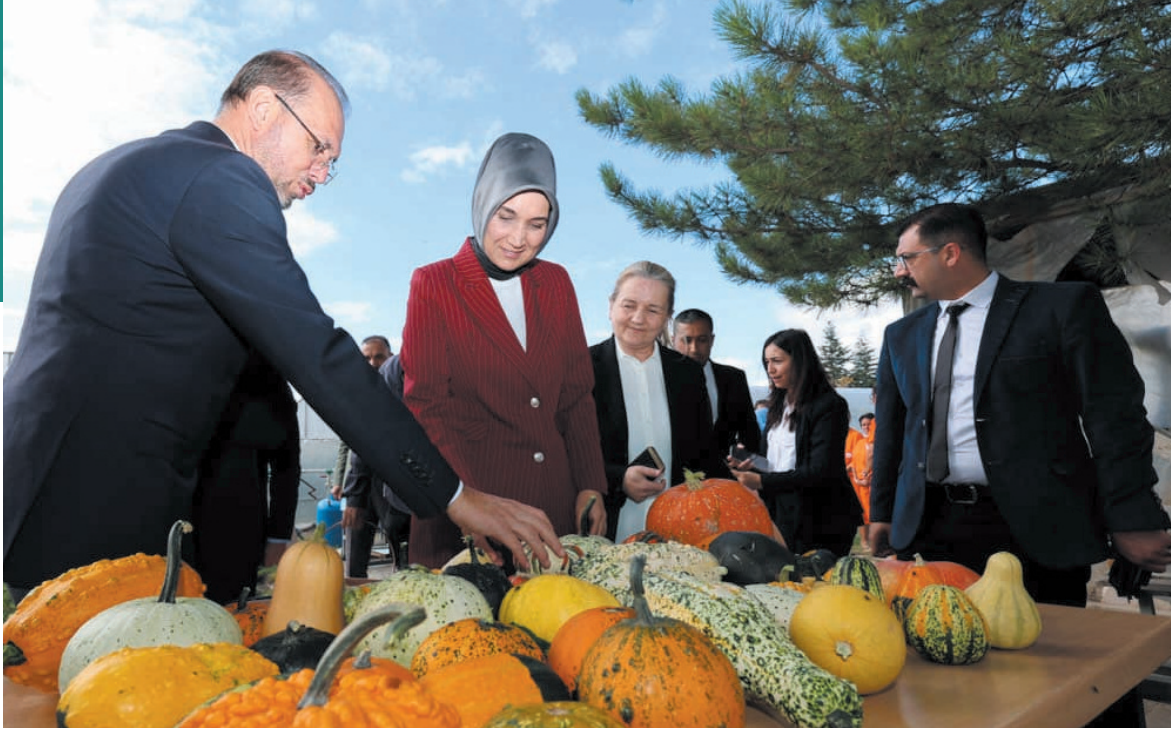
Valilik tarafından yapılan açıklamada, "Proje kapsamında İşıurtları Kurumu bünyesinde üretilen süs kabaklarının satış ve pazarlaması kadın kooperatifleri aracılığıyla gerçekleştirilecek" denildi.