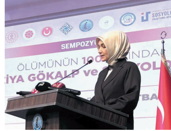
AKÜ ve İstanbul Üniversitesi Sosyoloji Araştırma Merkezi iş birliğiyle "Ölümünün 100. Yılında Ziya Gökalp ve Sosyoloji Sempozyumu" düzenlendi.

Cumhurbaşkanlığı İletişim Başkanı Fahrettin Altun, sempozyumda birbirinden değerli konu başlıklarının masaya yatırılacağına işaret ederek, şunları kaydetti: "Şahsım adına burada sunulacak tebliğ metinlerini okumayı büyük bir merakla, teccesüsle bekliyorum. İletişim Başkanlığı olarak, bu önemli sempozyumun paydaş olmaktan büyük bir memnuniyet duyduğumuzu da ifade etmek istiyorum. Ziya Gökalp gibi entelektüellerimizi anmak, onların fikirlerini günümüz koşullarında ulusal ve uluslararası kamuoylarının gündemine getirmek için yapılan bu çalışmalara büyük önem atfediyor, bu türden nitelikli çalışmalara her zaman destek olmaya gayret ediyoruz. Türkiye'nin entelektüel birikimini, fikri mültesebatını nazarı itibara almanın bu-