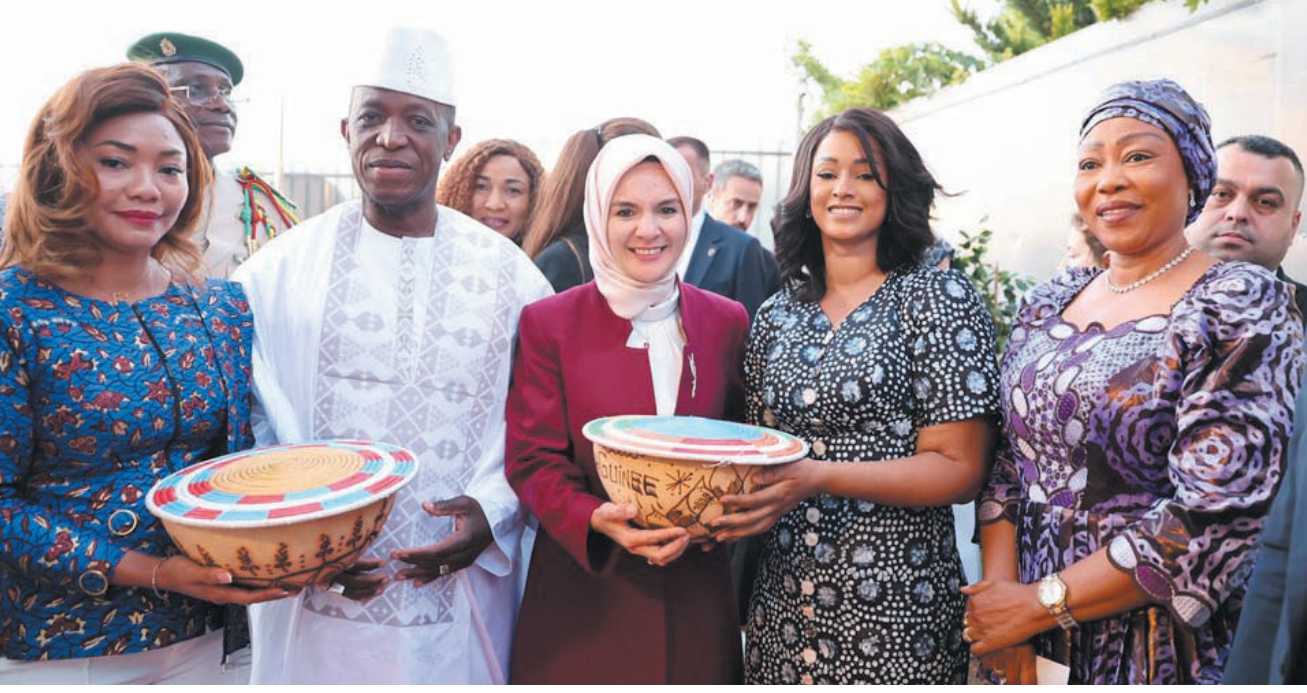
Türkiye'nin Afrika'da yürüttüğü faaliyetler açısından Gine'nin önemli bir yere sahip olduğunu belirten Göktaş, "Bu anlamda son 20 yılda, 'Afrika sorunlarına Afrikalı çözümler' ilkesi temelinde tıpkı Gine'de olduğu gibi Afrika ülkeleriyle ilişkilerimizde ve işbirliklerimizde kayda değer bir ivme kazandık"