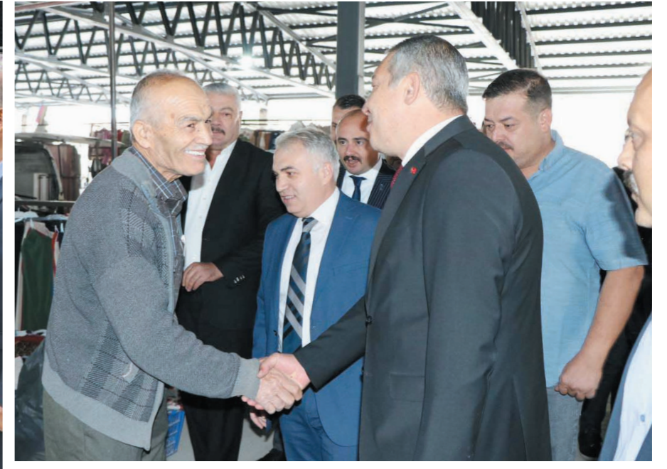
Esnaf, bu anlamlı günde hatırlanıp ziyaret edilmelerinden ve plaket takdim edilmesinden duydukları memnuniyeti dile getirerek heyet'e teşekkür ettiler. Ahilik Haftası Programı Esnaf ve Sanatkarlar Odasının ziyaret edilmesiyle son buldu.