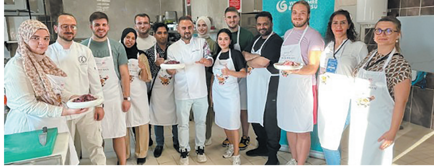
12 farklı ülkeden genç mutfak profesyonelleri ve gastronomi öğrencilerinden oluşan 12 katılımcı ve 4 görevli Afyonkarahisar mutfağı konferansı ve atölye çalışmasına katıldı.

Türk Havayolları Sponsorluğunda gerçekleşen program, Kültür ve Turizm Bakanlığı, Balıkesir Valiliği İl Kültür ve Turizm Müdürlüğü, İstanbul İl Millî Eğitim Müdürlüğü Beylerbeyi Sabancı Olgunlaşma Enstitüsü ve Hacı Bayram Veli Üniversitesinin katkıları ve Afyonkarahisar Valiliği destekleriyle düzenlendi. Almanya, Azerbaycan, Fas, İran, Kosova, Kuzey Kıbrıs Türk Cumhuriyeti, Pakistan, Polonya, Romanya, Sırbistan, Umman, Ürdün'ün içinde yer aldığı 12 farklı ülkeden genç mutfak profesyonelleri ve gastronomi öğrencilerinden oluşan 12 katılımcı ve 4 görevli Afyonkarahisar mutfağı konferansı ve atölye çalışmasına katıldı.