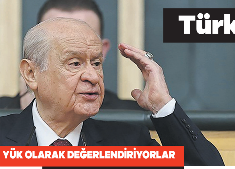
YÜK OLARAK DEĞERLENDİRİYORLAR