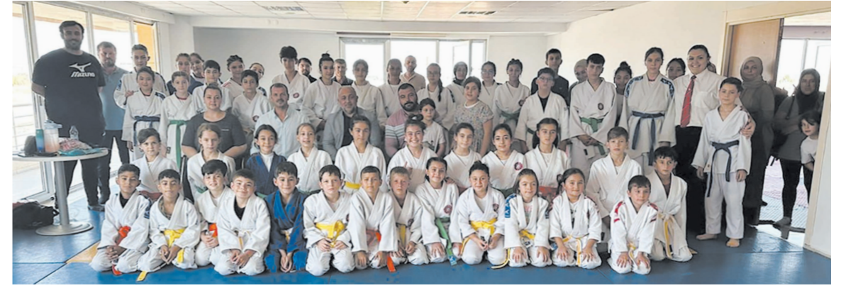
Zafer Haftası etkinlikleri kapsamında düzenlenen turnuva, genç sporcuların yeteneklerini sergilemeleri için önemli bir fırsat oldu