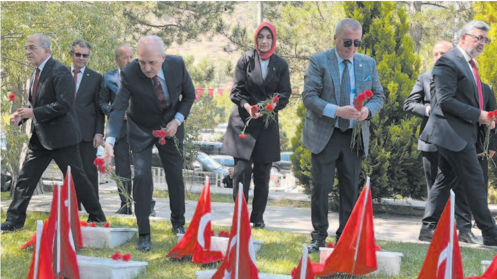
Törene katılanlar, Yüzbaşı Agah Efendi'nin ve tüm şehitlerin aziz hatırasını saygıyla yâd ederken, bu anlamlı günün, Milli Mücadele ruhunun gelecek nesillere aktarılması açısından taşıdığı büyük önemin altını çizdiler.