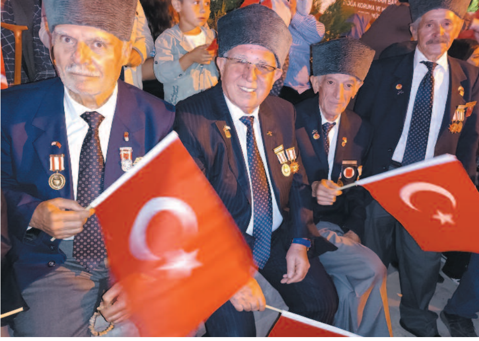
TBMM Başkanı Kurtulmuş, "Osmanlı coğrafyasının her yerinden bizim dedelerimiz buraya geldiler. Ya Allah diyerek ayağa kalkarak yedi düvele karşı bağımsızlık mücadelesini başlattılar. Başta Gazi Mustafa Kemal Atatürk olmak üzere bağımsızlık mücadelesinin öncüsü büyüklerimizi hürmetle saygıyla yad ediyoruz"

Büyük Taarruz'un 102. yıl dönümü kutlamaları, Afyonkarahisar'ın Şuhut ilçesinde Atatürk Evi'nin önünde düzenlenen törenle başladı